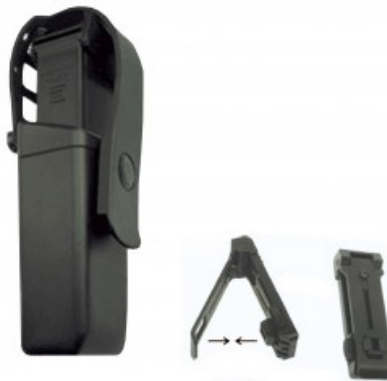
Portacargador universal MH-14S