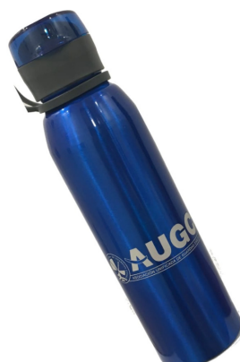
Botella AUGC 750 ml. De aluminio