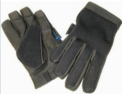
Guante anticorte y antipunzón Nivel de seguridad 5