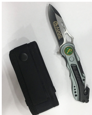
Navaja AUGC Fabricada por Albainox

Visita la tienda y descubre más... tienda.augc.org