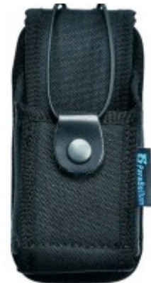
Porta walkie / sirdee universal

Visita la tienda y descubre más... tienda.augc.org