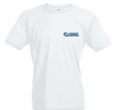
Camiseta técnica AUGC Tallas: S, M, L, XL, XXL