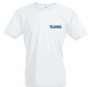
Camiseta técnica AUGC Tallas: S, M, L, XL, XXL