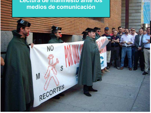
Lectura de manifiesto ante los medios de comunicación