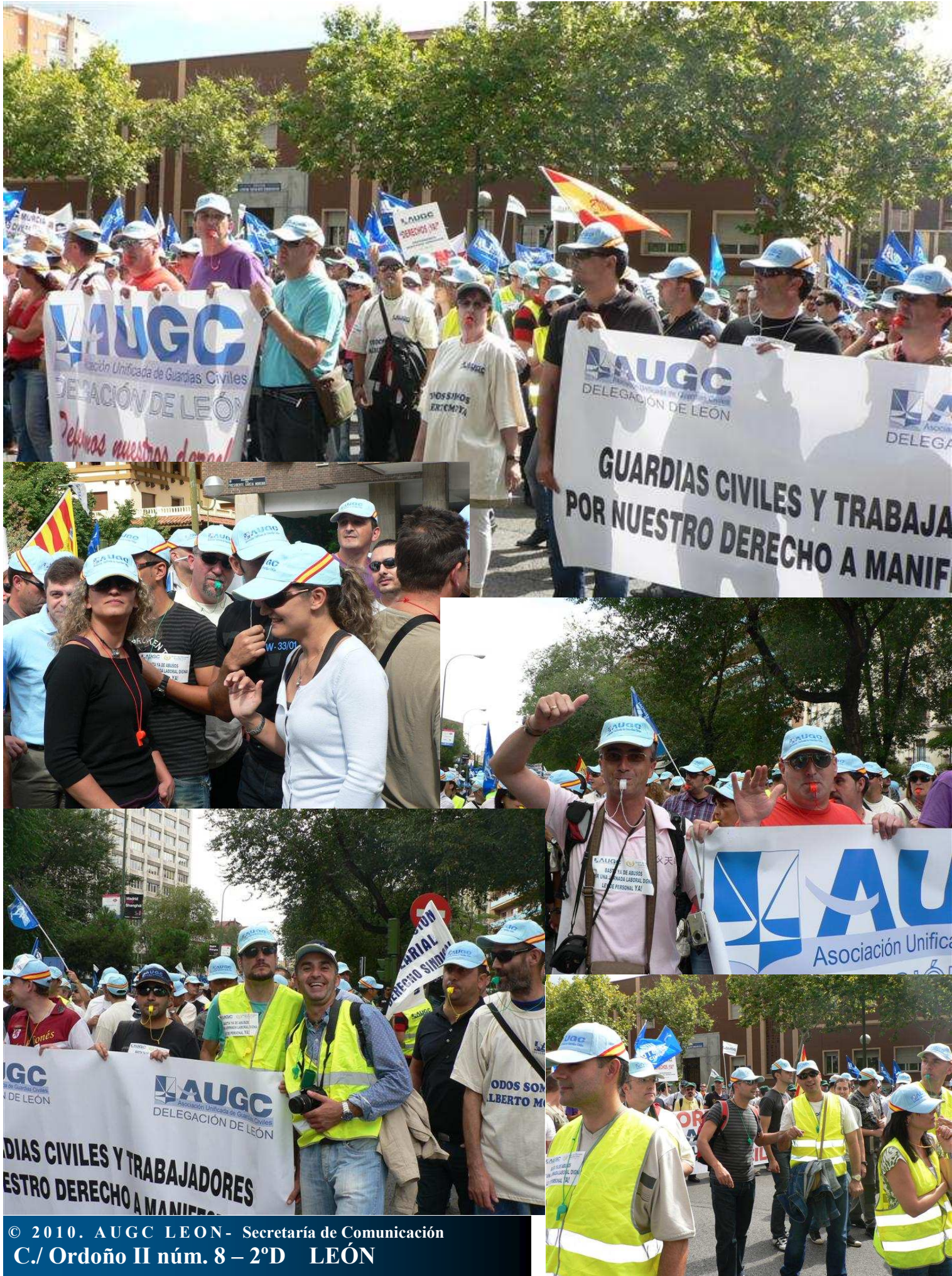
© 2010. AUGC LEÓN- Secretaría de Comunicación C./ Ordoño II núm. 8 – 2ºD LEÓN