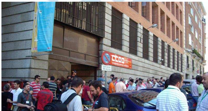
Representantes de las delegaciones a la entrada