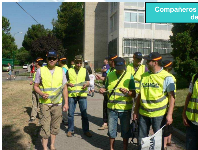
Compañeros de la Delegación de León