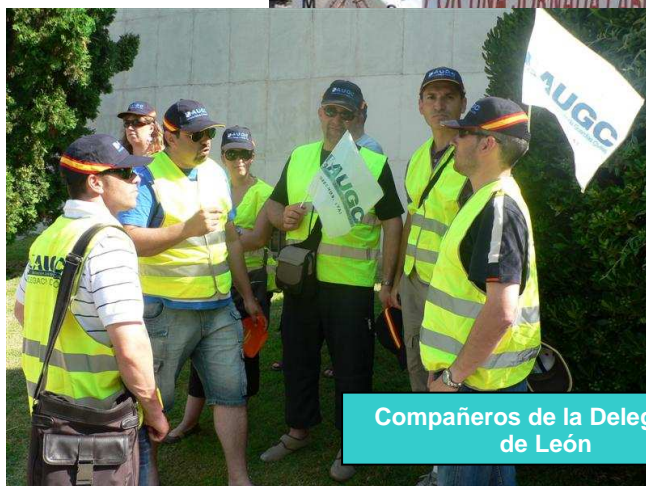
Compañeros de la Delegación de León