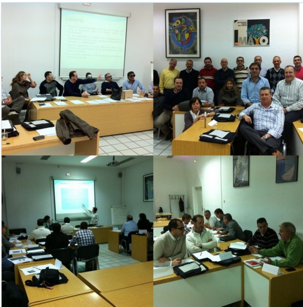
CUATRO MOMENTOS DEL DESARROLLO DEL CURSO IMPARTIDO EN LAS ESCUELAS MUÑOZ ZAPICO QUE CCOO TIENE EN MADRID

En esta edición, han asistido al curso miembros de las ejecutivas de AUGC en León, Madrid, Jaén, Cádiz, Burgos, Sevilla, Palencia, La Rioja y también inte-