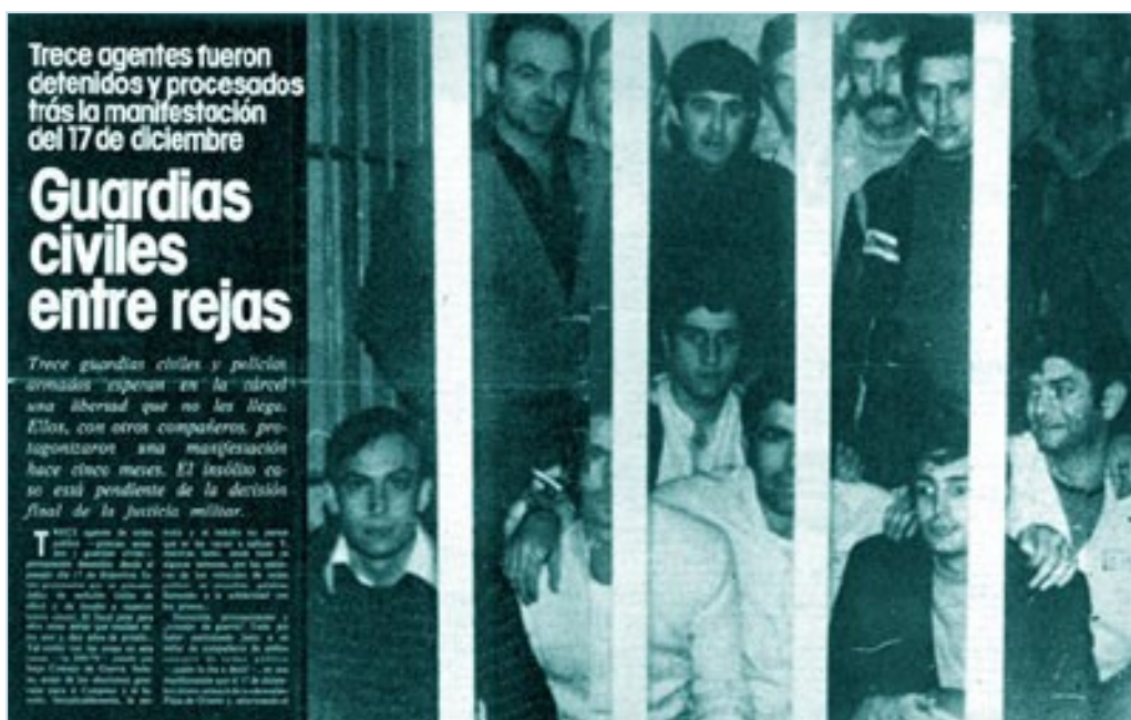
En la imagen reportaje sobre las detenciones de guardias civiles después de la manifestación protagonizada por guardias civiles y policías en diciembre de 1976, la semilla de donde años más tarde surgiría AUGC.

Sobre los cimientos de la manifestación de diciembre de 1976 -en la cual participaron varios cientos de guardias civiles y policías-, y posteriormente el SUGC, comenzó la construcción de lo que ahora es AUGC. Hubo que esperar a 1990 para datar los primeros intentos de inscribir una asociación