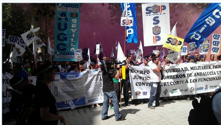
Imagen de la concentración de trabajadores andaluces de la "seguridad" ante la Delegación del Gobierno en Sevilla

Como dijimos en la presentación a los medios de comunicación la creación de esta plataforma es histórica, nunca antes había-