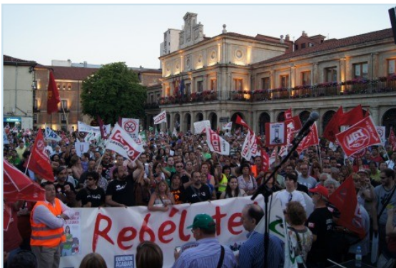
Manifestación contra los recortes celebrada en la capital leonesa el pasado 19 de julio en la que participó activamente AUGC León.

A UGC-León considera que la gravedad de la crisis económica y los duros recortes introducidos por el Gobierno en sus últimas decisiones políticas hacen inevitable plantearse el cierre de la mitad de los cuarteles de la Guardia Civil en León, por las dificultades a las que se van a enfrentar en materia de habitabilidad. Ya que «si en época de vacas gordas, las carencias en la Guardia Civil eran escandalosas estos recortes van a suponer volver 40 años atrás. Los recortes afectarán a la dotación de material, al mantenimiento y sustitución de los vehículos y por supuesto a la conservación de los cuarteles en un estado de habitabilidad digno-que por cierto la mayoría de ellos no han alcanzado- por lo que es urgente, exigen desde la Organización, una reorganización adecuada con la supresión de al menos el 50% de los