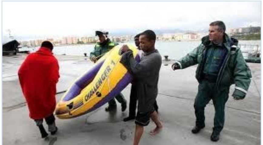
Agentes de la guardia civil de Canarias atendiendo a inmigrantes llegados en patera hasta una de las playas del Archipiélagos.

fecha de hoy que se sepa lo del puente de Valencia a Mallorca es sólo una ilusión de una canción veraniega, y, ni que decir tiene, desde cualquier punto de la península a Canarias. Para los agentes que prestan servicio en las Islas la situación es la misma, de poco les sirve que tengan más vuelos o más barcos que les comuniquen con la península. SIEMPRE SEGUIRÁ SIENDO MUCHO MÁS GRAVOSO PARA SUS BOLSILLOS UN BILLETE DE