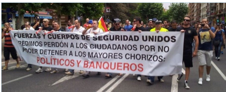
Concentración frente a la Delegación del Gobierno en la Rioja de los sindicatos policiales y AUGC la Rioja.

tir -no sin luchar- que se les despoje a los guardias civiles de los derechos laborales y salariales básicos, que tanto esfuerzo ha costado conseguir". Además desde la Organización se vuelve a reiterar que son "el Cuerpo Policial que más trabaja y menos cobra, con unas condiciones laborales impensables en cualquier otro servidor público de este país y con los derechos fundamentales y profesionales severamente restringidos, tales como el derecho de sindicación, y por tanto, de huelga o de negociación colectiva". Pero es que además, denuncian desde AUGC León también han pretendido recortar a los guardias civiles otros derechos como el de reunión a través de la modificación de la Ley Orgánica de derechos y deberes de los integrantes de la Guardia Civil.