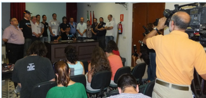
Rueda de prensa de presentación de la Plataforma

La Plataforma está integrada por SUP, CEP, SPP, UPF en representación del Cuerpo Nacional de Policía, Sppme-A, UPLB-A y SIP-AN, en nombre de las Policías Locales, AUGC, como único representante de los guardias civiles, el Sindicato de Trabajadores de Justicia (STAJ), la Agrupación de los Cuerpos de la Administración de Instituciones Penitenciarias (Acaip), la Federación