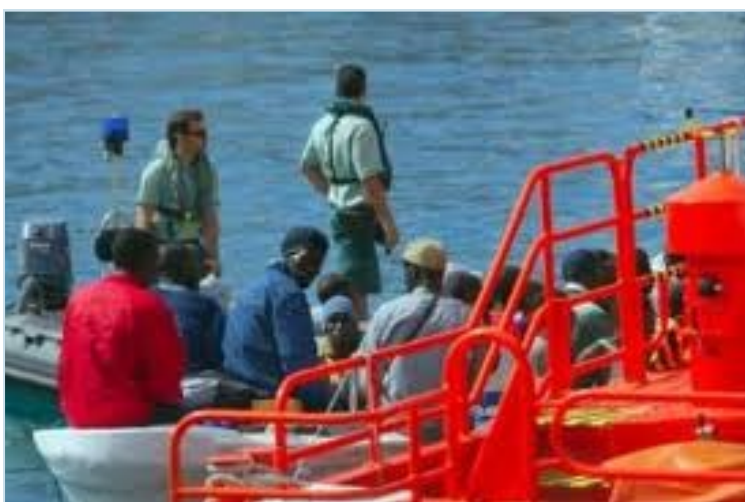
Patrullera de la Guardia Civil socorre una patera que se aproxima a la playa.

Una vez más otro gobierno ha quedado retratado para los guardias civiles: les trata como funcionarios para recortarles el sueldo y les reconvierte en militares para poder usarlos de marionetas y así manejarlos a su antojo.