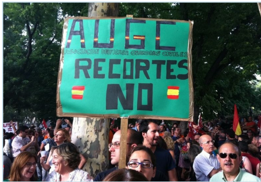
AUGC participará en cuanta concentración se convoque contra los recortes

Así las cosas, un mando de la Dirección, hizo una exposición donde se pretendía determinar las posibilidades y margen que permitía el RD-ley de adaptación al Cuerpo, como por ejemplo, que la reducción de la paga extraordinaria puede ser prorrateada entre los siguientes meses, a partir del actual, para que el impacto en diciembre no sea tan sensible,