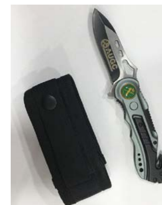
Navaja AUGC Fabricada por Albainox