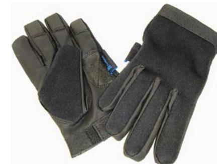
Guante anticorte y antipunzón Nivel de seguridad 5