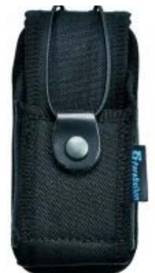
Porta walkie / sirdee universal