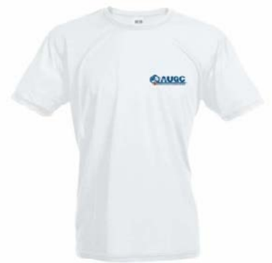
Camiseta técnica AUGC Tallas: S, M, L, XL, XXL