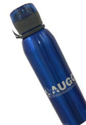
Botella AUGC 750 ml. De aluminio