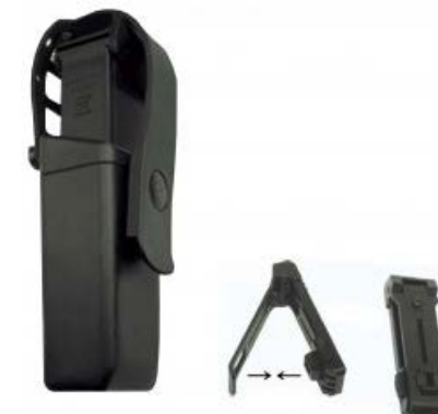
Portacargador universal MH-145