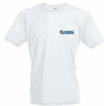
Camiseta técnica AUGC Tallas: S, M, L, XL, XXL