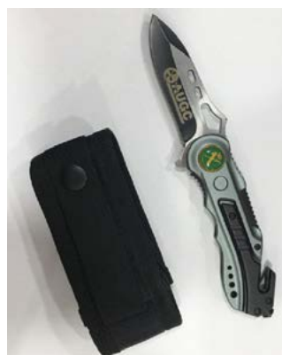
Navaja AUGC Fabricada por Albainox