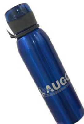
Botella AUGC 750 ml. De aluminio