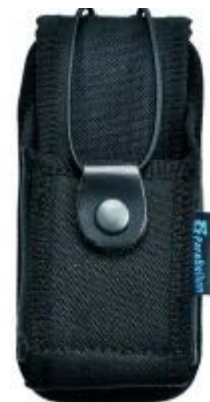
Porta walkie / sirdee universal