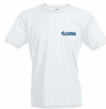
Camiseta técnica AUGC Tallas: S, M, L, XL, XXL