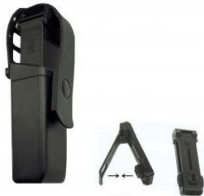
Portacargador universal MH-145