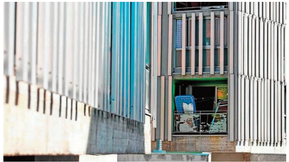
Pabellones de la Guardia Civil en la calle Fuenlabrada nº 75, Parla.

ha propiciado la ocupación ilegal de la mayoría de pisos. En uno de los últimos plenos celebrados en el municipio, el Partido Popular presentaba una moción para que se esclarezcan los hechos que han