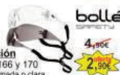
BLINE 4,90€ Gafa Protección 2,90€ Certificado EN166 y 170 Versión lente ahumada o clara