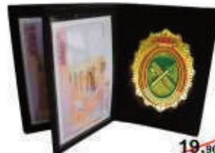
PVA4001 19,90€ Cartera Piel + Placa GC 9,90€ 4 cuerpos + billettero