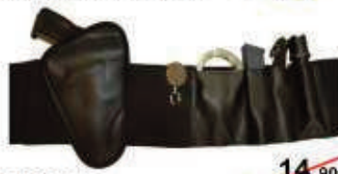
PVC1011 14,90€ Faja Porta-armas 5,95€ Elástica, interior, cierre velcro