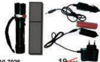
PVL7026 19,90€ Linterna táctica LED 3W 11,90€ 180 lumens, zoom, Incluye: batería, cargador coche, cargador luz y funda.