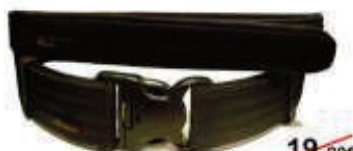
Gs1000 19,90€ Cinturón doble Seguridad 11,90€ Alta calidad. 5 tallas (S a XXL)