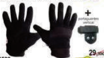
Pv3509 29,90€ Guante Combat Pro 14,90€ Anticorte L5, Palma Amara, alto nivel de resistencia y penetración, S a XXL