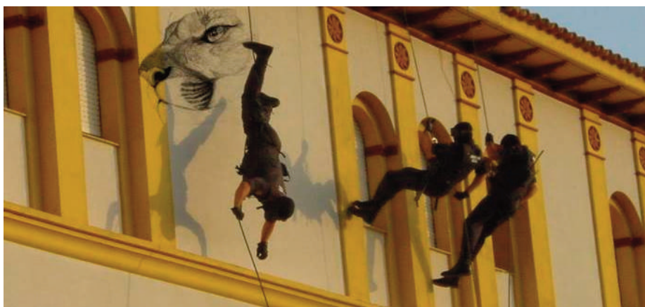
Situaciones en las que los componentes del GRS denuncian la pérdida del arma de la caimanera.

dotar de una prenda de abrigo (forro polar, cortavientos, cazadora, etc) que se adapte plenamente a las necesidades de los componentes de la Agrupación de Reserva y Seguridad y a servicio peculiar, para ser presentado al Grupo de Trabajo de la Junta Permanente de Uniformidad para su estudio y evaluación”, según reza la contestación a la propuesta remitida al Consejo.