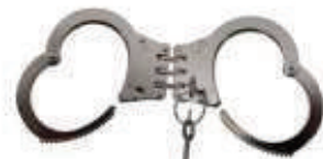
PVG1001 17,90€ Grillete Bisagra 9,90€ Alta calidad. 2 llaves