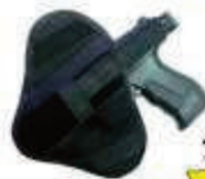
PVF1004 14,90€ Funda Arma Universal Cordura 7,90€ Ambidiestra, Uso Interior-Exterior