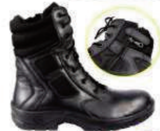
COATTACK 94,90€ Bota Security Zipper 8" 84,90€ Piel flor, piso poliuretano doble densidad