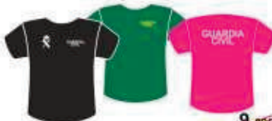
Camiseta "Guardia Civil" 9,90€ 100% Algodón, Tallas Niño y Adulto Varios modelos, serigrafía en pecho y espalda 4,90€