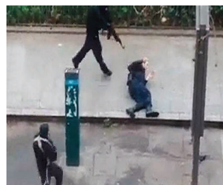
Ataque terrorista en París contra un gendarme.

considerando la caimanera adecuada al servicio. Sin embargo también reconoce que la idónea sería una fabricada en material polímero. No obstante, su precio es cinco veces superior y la modernización de la funda “se materializará cuando las circunstancias lo permita”, según la oficina de apoyo. Estas situaciones en el GRS se suman a otra demanda de AUGC Madrid para la unidad, sobre la realización de los desfiles de protocolo y honores como por ejemplo en la pasada festividad de la Virgen del Pilar, cuando se antepuso el desfile militar sobre la seguridad ciudadana, empleando al GRS en preparar y ensayar la parada en lugar del trabajo policial propiamente dicho.