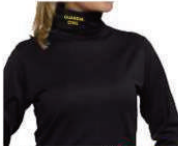
PVCACU 19,90€ Camiseta Térmica Interior 14,90€ Bordado en cuello, fabricada en España