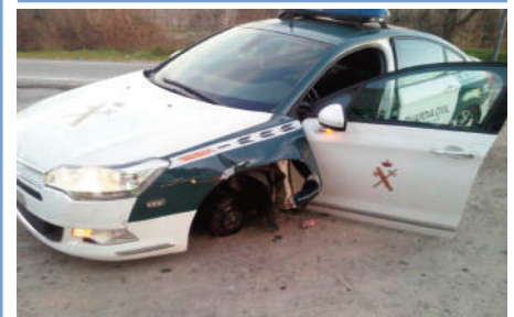
El accidente se saldó afortunadamente sin heridos.

El estado de los vehículos de Guardia Civil sigue poniendo en riesgo a los agentes, como el accidentado este mes de enero en Valdemoro. Su cuentakilómetros marcaba una cifra de 450.000 kilómetros, suficiente como para haber dado con él 10 vueltas completas alrededor de la tierra. Afortunadamente, el siniestro se saldó sin heridos.