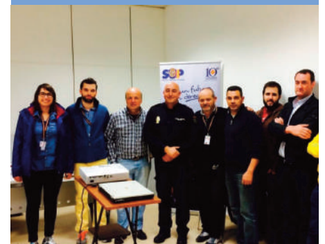
El curso celebrado en colaboración con SUP Madrid.

AUGC y SUP forman a sus afiliados en prevención de robos