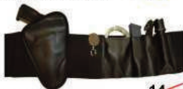
PVC1011 14,90€ Faja Porta-armas 5,95€ Elástica, interior, cierre velcro