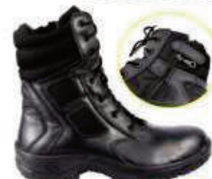
COATTACK 94,90€ Bota Security Zipper 8" 84,90€ Piel flor, piso poliuretano doble densidad