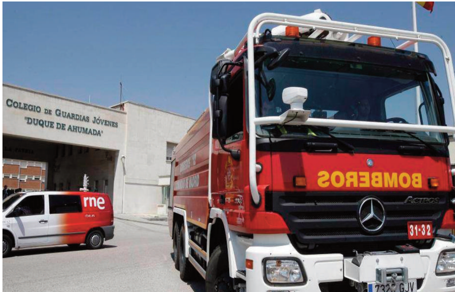
Los servicios de emergencias frente a las instalaciones de Valdemoro la fecha del suceso.