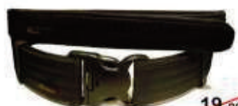
Gs1000 19,90€ Cinturón doble Seguridad 11,90€ Alta calidad. 5 tallas (S a XXL)