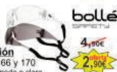
BLINE 4,90€ Gafa Protección 2,90€ Certificado EN166 y 170 Versión lente ahumada o clara