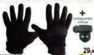
Pv3509 29,90€ Guante Combat Pro 14,90€ Anticorte L5, Palma Amara, alto nivel de resistencia y penetración, S a XXL