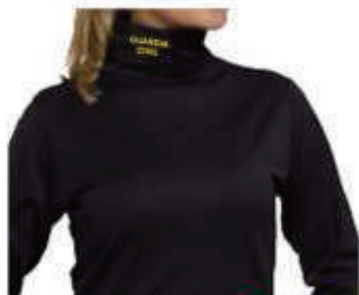
PVCACU 19,90€ Camiseta Térmica Interior 14,90€ Bordado en cuello, fabricada en España