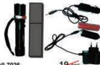
PVL7026 19,90€ Linterna táctica LED 3W 11,90€ 180 lumens, zoom, Incluye: batería, cargador coche, cargador luz y funda.