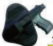
PVF1004 14,90€ Funda Arma Universal Cordura 7,90€ Ambidiestra, Uso Interior-Exterior