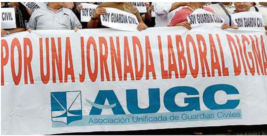
La dignificación de la jornada laboral ha sido siempre uno de los ejes de acción de AUGGC.