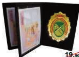
PVA4001 19,90€ Cartera Piel + Placa GC 9,90€ 4 cuerpos + billettero