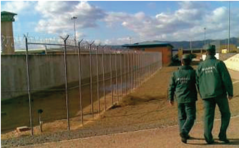
Agentes de la Unidad de Protección y Seguridad en un centro penitenciario.