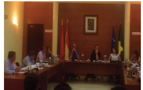
Imagen del Pleno municipal en que se aprobó la moción.

El pasado 10 de septiembre de 2015, el Pleno del Ayuntamiento del municipio madrileño Manzanares El Real, aprobó una moción en defensa de los derechos laborales y profesionales de los Guardias Civiles, así como de rechazo a los expedientes disciplinarios de los representantes asociativos de la Asociación Unificada de Guardias Civiles (AUGC) y de la modificación del Código Penal Militar y su aplicación a los Guardias Civiles en el ejercicio de sus funciones policiales.