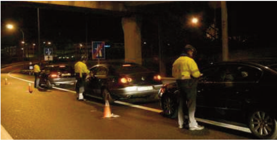
Un control nocturno de la Guardia Civil en carretera.

vicio al ciudadano. Últimamente hemos asistido a la inauguración del Destacamento de Paracuellos del Jarama, producto del traslado a aquella localidad del Destacamento de Barajas. Si este último estaba ubicado en la zona aeroportuaria y cercano a la autovía A-2, sus principales áreas de responsabilidad, su traslado ha supuesto que actualmente se encuentre en el interior de un casco urbano alejado de aquellas. Acceder a ellas supone circular durante varios kilómetros por vías secundarias, con única calzada y doble sentido de circulación. Pero si desde un punto de vista operativo la decisión del traslado es más que cuestionable, no lo deja de ser en cuanto a la dotación de las nuevas instalaciones. Se han ubicado de la planta baja de un edificio municipal, que no fue diseñado con fines policiales y que carece de lo más mínimo para el desempeño de tal función. Aún no ha habido justificación oficial a dicho traslado. Pero aún más sangrante es la forma en que se organizan y distribuyen los cometidos a realizar por los Agentes durante su servicio. Siempre hemos reclamado una Agrupación al servicio del ciudadano, usuario de las vías. Sin embargo, de frente hemos encontrado una Agrupación interesada en aumentar constantemente los objetivos de denuncias formuladas, con las que satisfacer las ambiciones financieras del Ministerio de Hacienda. Las pre-