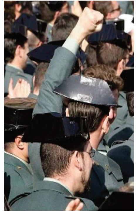
Imagen de la manifestación en Madrid en 2007.

Pero hay más motivos. Sobre todos se cierne la sombra de la aplicación del Código Penal Militar, a pesar de que nuestro trabajo se desarrolle sobre todo en torno a cuestiones policiales. AUGC mantiene que se deje de aplicar a los agentes como una de sus principales reivindicaciones. Pero además hemos visto como la nueva Orden General de Jornada Laboral ha sido interpretada en perjuicio de los guardias. La organización está obsoleta y es el ciudadano el que padece los efectos de estas deficiencias. Del mismo modo encontramos