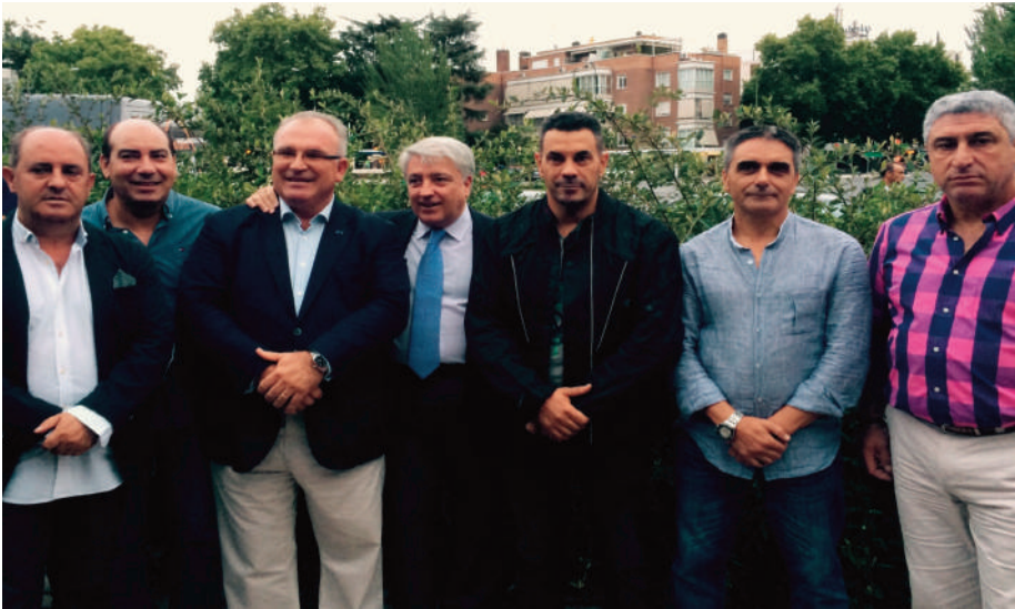
El Secretario General de AUGC Madrid (centro) junto a supervivientes del atentado en el acto de homenaje.