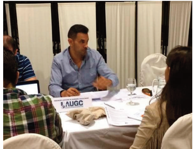
A la izquierda un agente de un destacamento de Tráfico. A la derecha, el Secretario General de AUGC Madrid durante el encuentro con los medios.