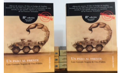
La novela te espera en la Delegación de AUGC Madrid.