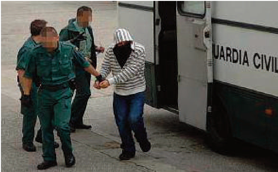
Conducción de un detenido a un juzgado.