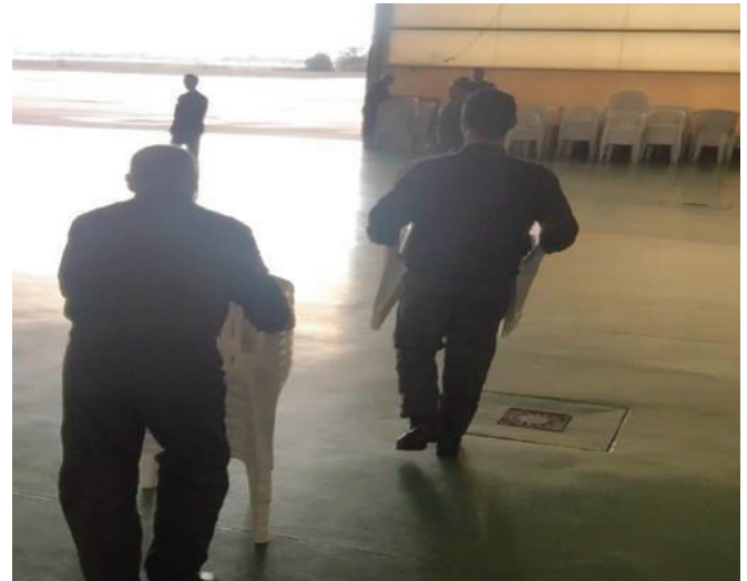
A la izquierda el hangar preparado para el evento de imposición del fajín. A la derecha, los mecánicos del servicio aéreo recogiendo sillas.