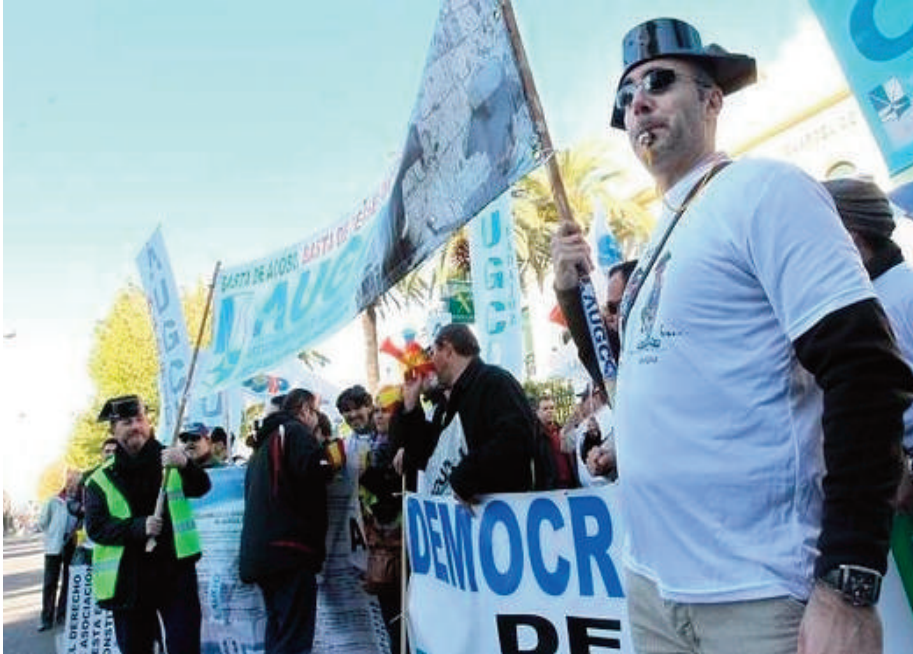
Imagen utilizada como emblema de la campaña iniciada por AUGC.