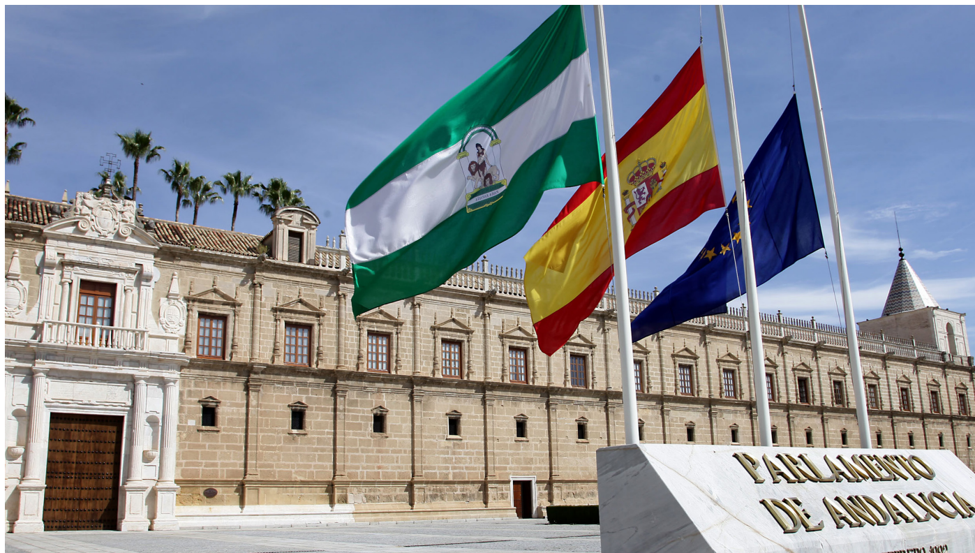
Fachada principal de la sede del Parlamento de Andalucía, en Sevilla.

El Parlamento de Andalucía ha aprobado una Proposición No de Ley apoyando las reivindicaciones de la Asociación Unificada de Guardias Civiles (AUGC) con los votos a favor de PSOE, Podemos, Ciudadanos e Izquierda Unida, y el voto en contra del Partido Popular. Dicha PNL rechaza la utilización del régimen disciplinario para impedir a los representantes legales de las asociaciones defender los derechos de los trabajadores de la Guardia Civil. También se insta al Gobierno a derogar la aplicación del Código Penal Militar a los guardias civiles en sus funciones policiales habituales.