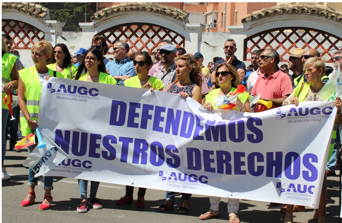
En la concentración participaron numerosos familiares de los guardias civiles sancionados.

Puedes ver vídeos de la concentración en este enlace , aquí , y en este otro .