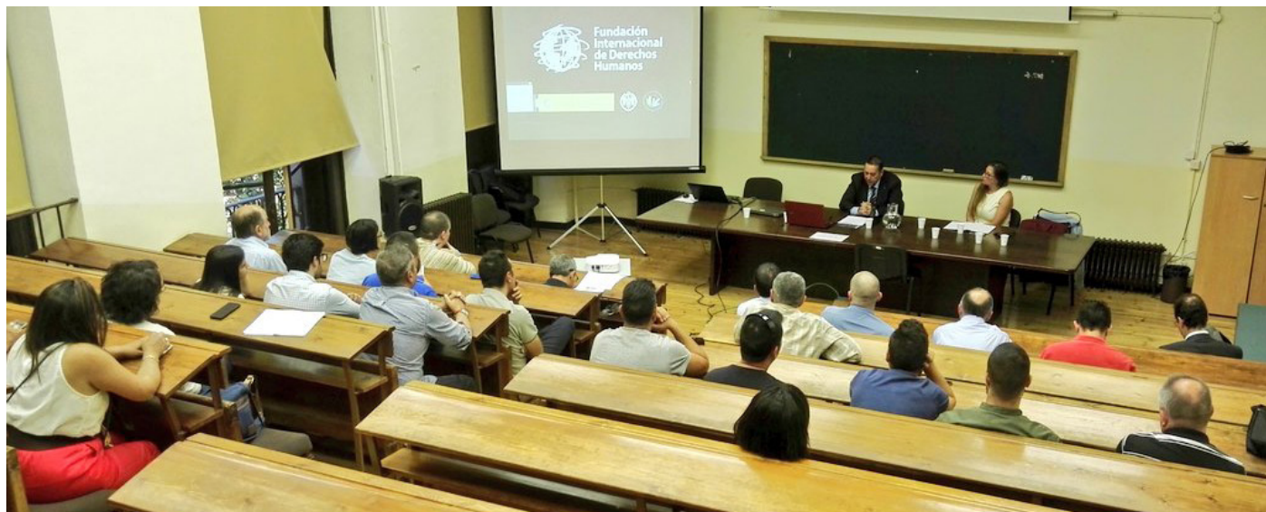
Vista general del aula donde tuvieron lugar las Jornadas.

El lunes 20 de junio se celebraron en Madrid las Jornadas Universitarias de Derechos Humanos ‘Por la abolición de la Jurisdicción Penal Militar en Tiempo de Paz ’, en cuya organización han colaborado la Universidad Complutense de Madrid, la Fundación Internacional de Derechos Humanos, la Euro Mediterranean University Institute (EMUI) y la Asociación Unificada de Guardias Civiles (AUGC) . Diversos ponentes abordaron en esas jornadas un asunto que afecta directamente a los guardias civiles, después de la remilitarización sufrida por el Cuerpo durante la legislatura de gobierno del Partido Popular.