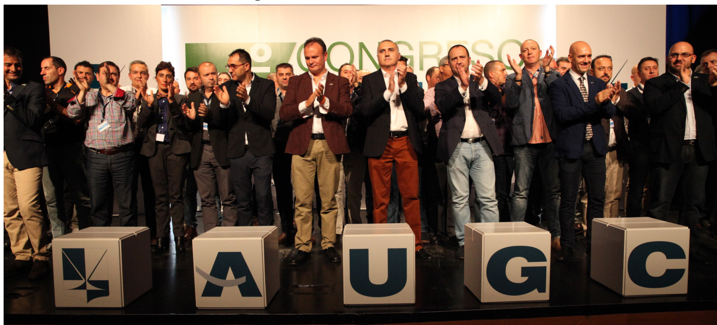
La Junta Directiva Nacional y otros representantes de AUGC saludan a los asistentes al final del acto.

Más de un millar de guardias civiles abarrotaron el miércoles 26 de octubre el Auditorio Marcelino Camacho, en la sede de Comisiones Obreras en Madrid, para reivindicar una vez más derechos y libertades sociolaborales para los guardias civiles.