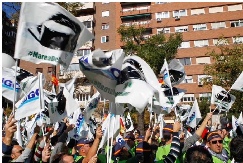
Imagen de la manifestación del 14 de noviembre de 2015