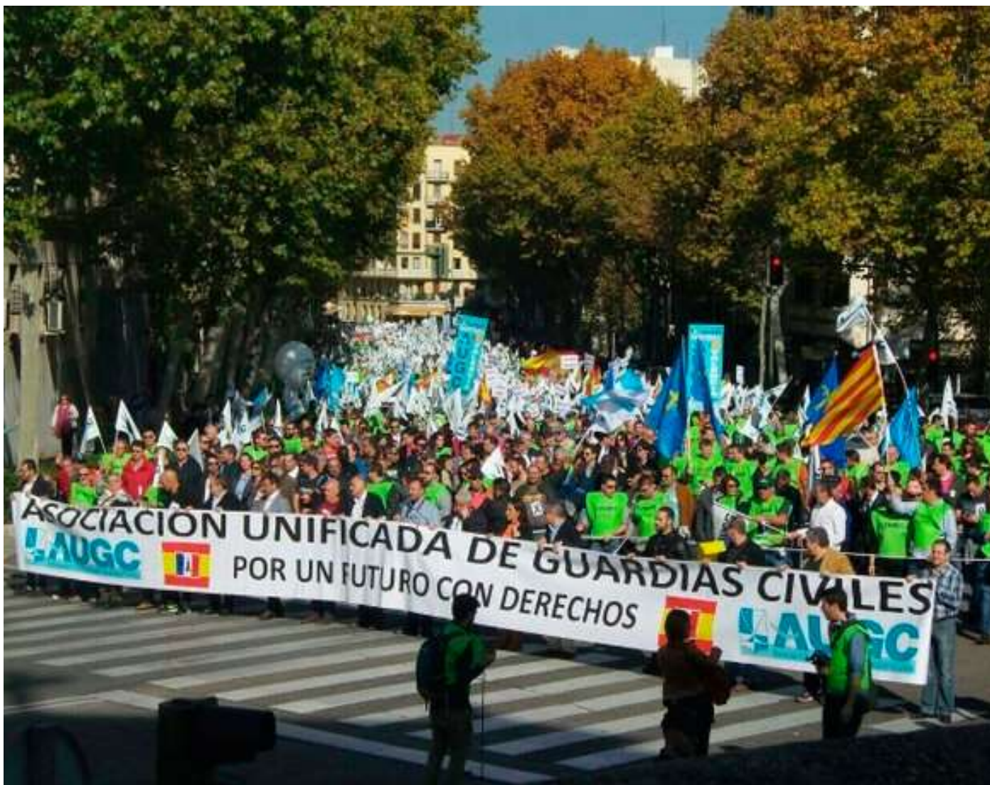
La manifestación del 14 de noviembre de 2015 fue prohibida por la Delegación de Gobierno de la Comunidad de Madrid