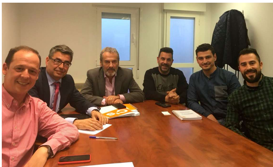
La delegación de AUGC Madrid con los representantes de Ciudadanos de Majadahonda

La Jefatura nos dijo que los interesados en hacer estos cursos deberían hacérselo saber a su jefe de unidad para poder hacer un estudio de los cursos disponibles y tratar de que los realicen. Bajo esta premisa, desde AUGC Madrid recomendamos a tod@s los compañer@s interesados en recibir formación que soliciten este tipo de cursos. ■