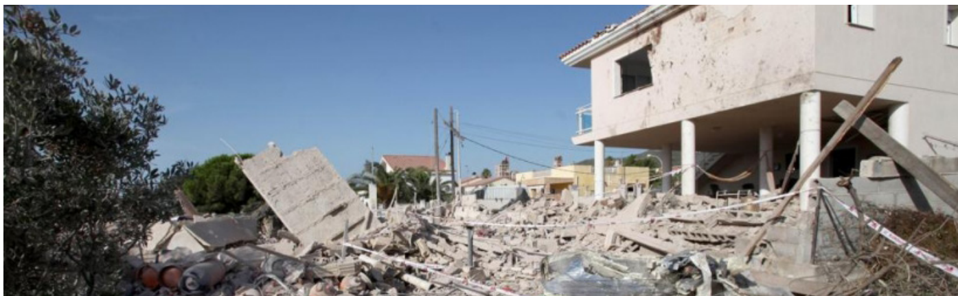
Estado del chalet de Alcanar tras la explosión que tuvo lugar el día anterior a los atentados.