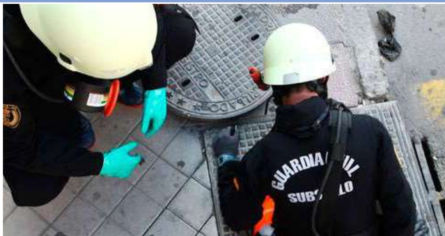
Dos agentes de la Unidad de Reconocimiento de Subsuelo de la GC, en una foto de archivo.

Por otra parte, nos gustaría saber qué criterios ha tomado la superioridad para decidir el traslado. Parece claro que no se han basado en criterios de operatividad, puesto que una