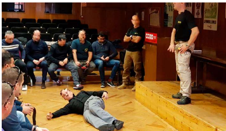
Un momento del curso de Instrucción Técnico Sanitaria.

El pasado 26 de enero tuvo lugar uno de los cursos de formación que AUGC Madrid ofrece a sus asociados dentro de su plan de formación continua.