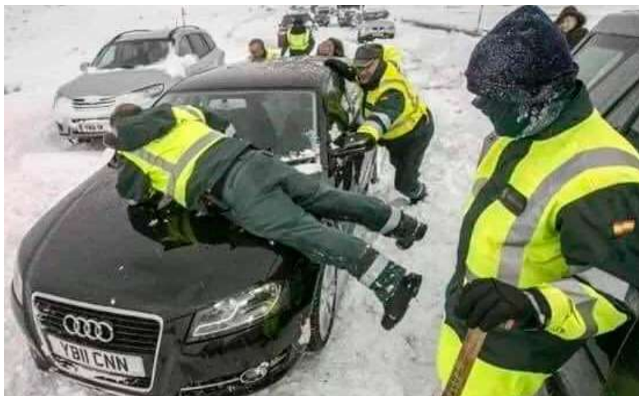
Varios guardias civiles intentan sacar de la carretera los coches bloqueados por la nieve.

Esta situación es, además, una consecuencia añadida del problema principal que existe: la reducción de plantilla de guardias civiles de Tráfico, que ha perdido en seis años cerca de un millar de agentes, a lo que se añade el cierre de unidades de atestados. Un recorte que se ve