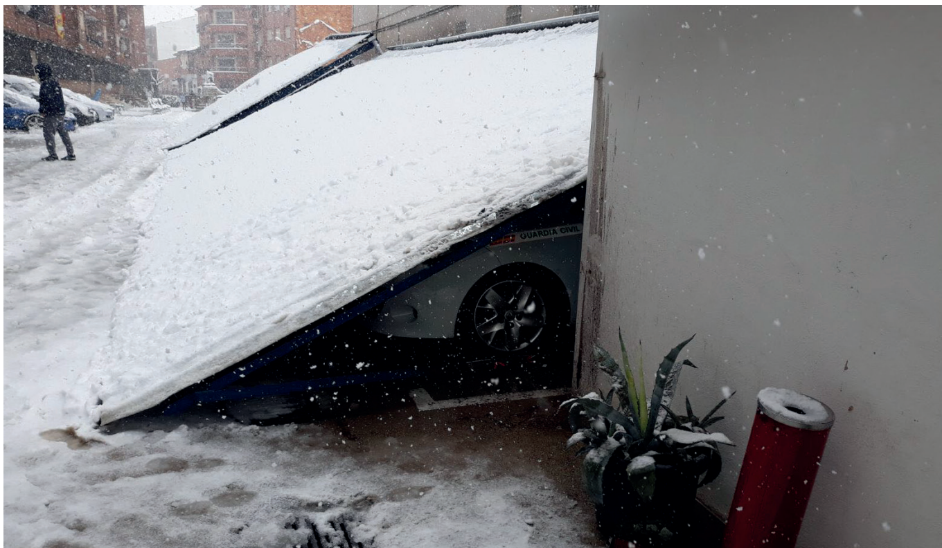
Imagen de la cubierta hundida sobre un vehículo oficial.