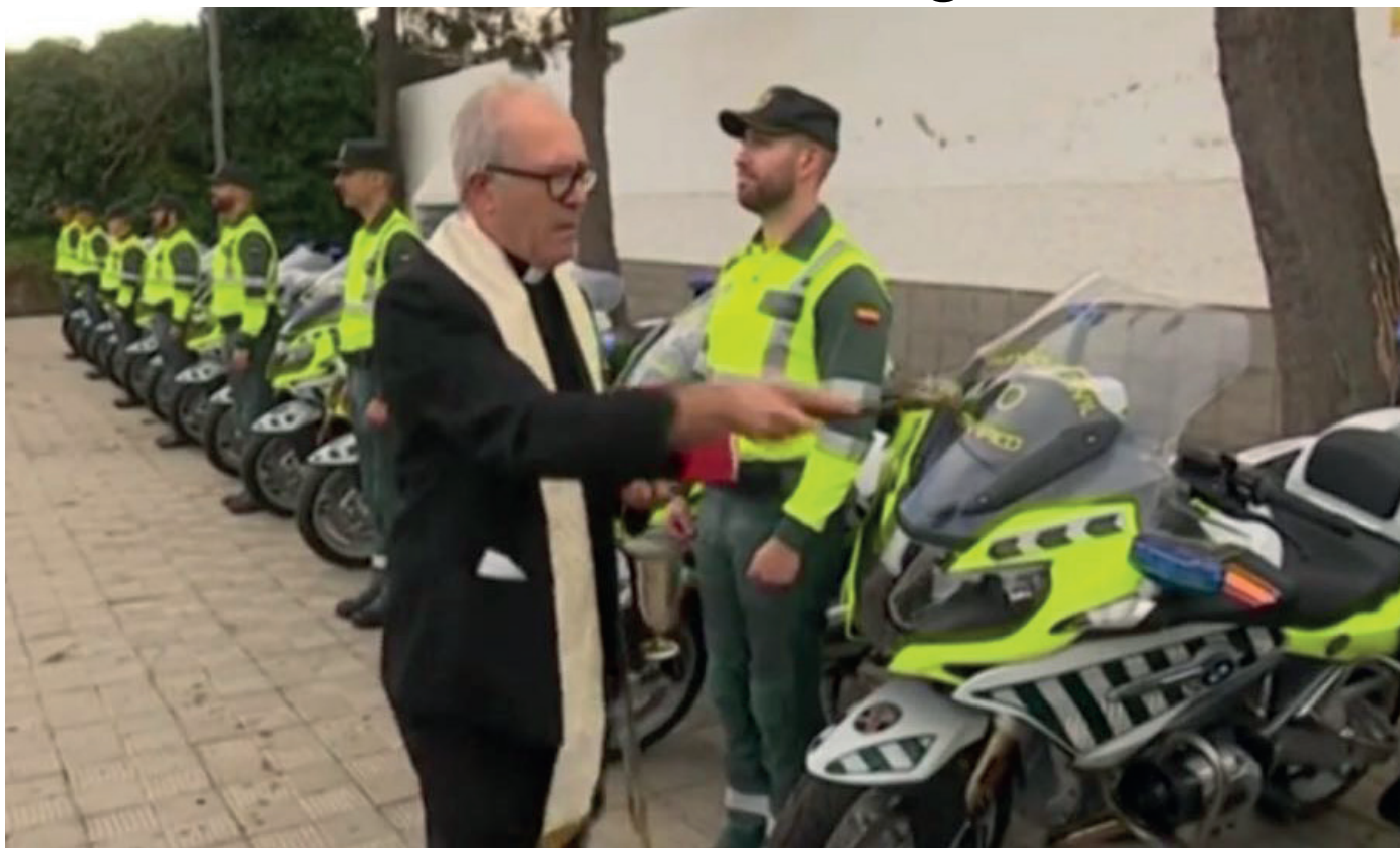
Un sacerdote rocía con agua bendita las nuevas motocicletas presentadas en Tenerife.

La Agrupación de Tráfico de la Guardia Civil presentaba el pasado 23 de enero a bombo y platillo ante los medios de comunicación canarios 18 nuevas motocicletas que serán empleadas en el Destacamento de San Cristóbal de La Laguna (Santa Cruz de Tenerife). Los nuevos vehículos vienen a sustituir a las viejas motocicletas, auténticas piezas de museo, cuyo lamentable estado había sido ya denunciado por AUGC.