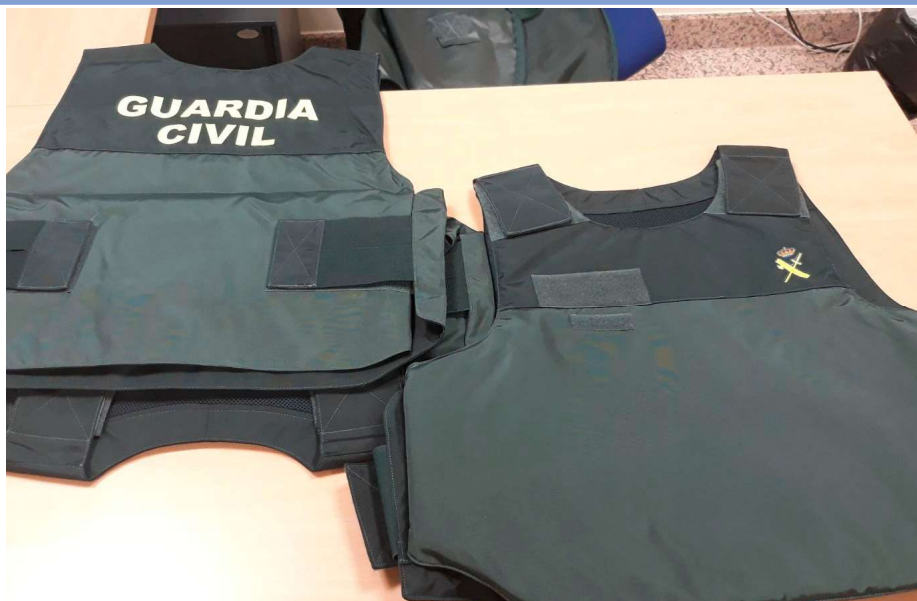
Los nuevos chalecos que han llegado al cuartel de Valdemoro.

Sin embargo, el oficial al mando denegó su uso, ordenando que utilizara uno masculino a sabiendas de