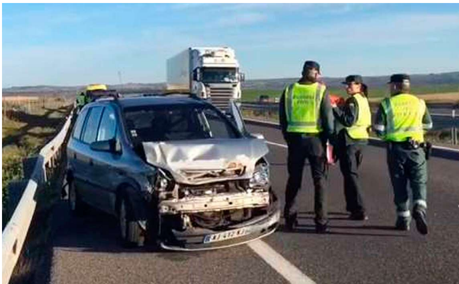
Una de las claves para reducir la siniestralidad es la presencia de agentes en carretera

Por ello, y con la idea de velar también por la seguridad vial del ciudadano, avalados por la experiencia que los guardias civiles de Tráfico han adquirido patrullando las carreteras, la Coordinadora Sectorial de AUGC propuso las siguientes medidas: