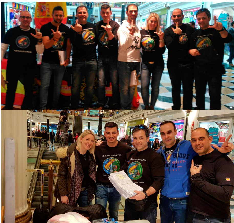
Los guardias civiles y policías recogieron más de 8.000 firmas en un día

En las próximas semanas, Jusapol presentará la ILP, que ya está avalada por las 500.000 firmas necesarias, para que sea estudiada por el Congreso de los Diputados.