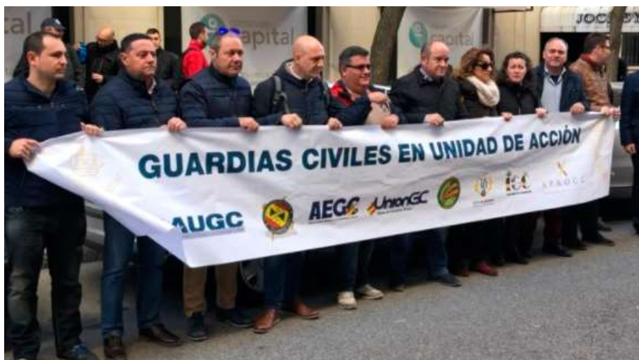
Varios guardias civiles se manifiestan con una pancarta frente al Ministerio del Interior

Estos 1.100 millones supondrían una mejora, en 12 pagas, de 561,44 euros brutos más al