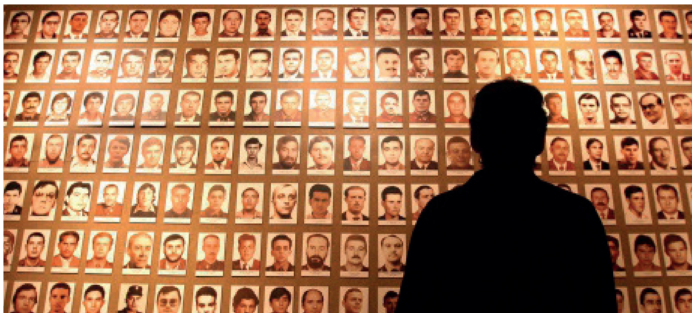
Un espectador contempla una panel con las fotografías de guardias civiles asesinados por ETA.

Nuestra asociación profesional es la única que ha combatido a la banda en el terreno judicial