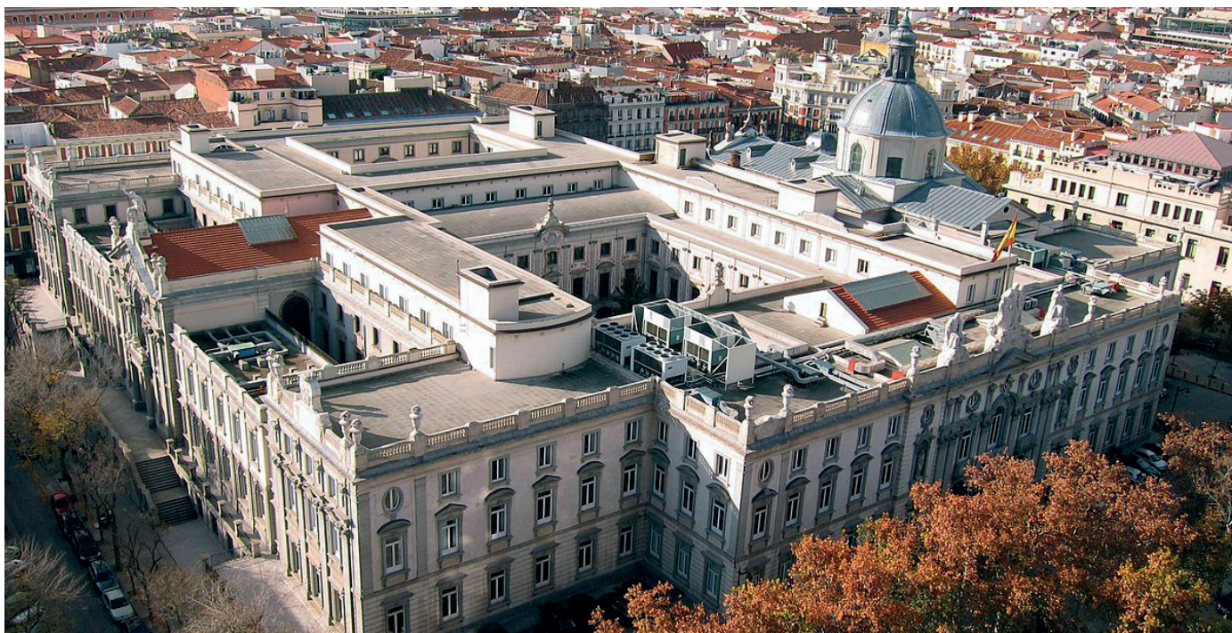
Edificio en Madrid sede del Tribunal Supremo.

AUGC ha defendido en solitario una vez más a los guardias civiles en los tribunales ante la inacción del resto de asociaciones