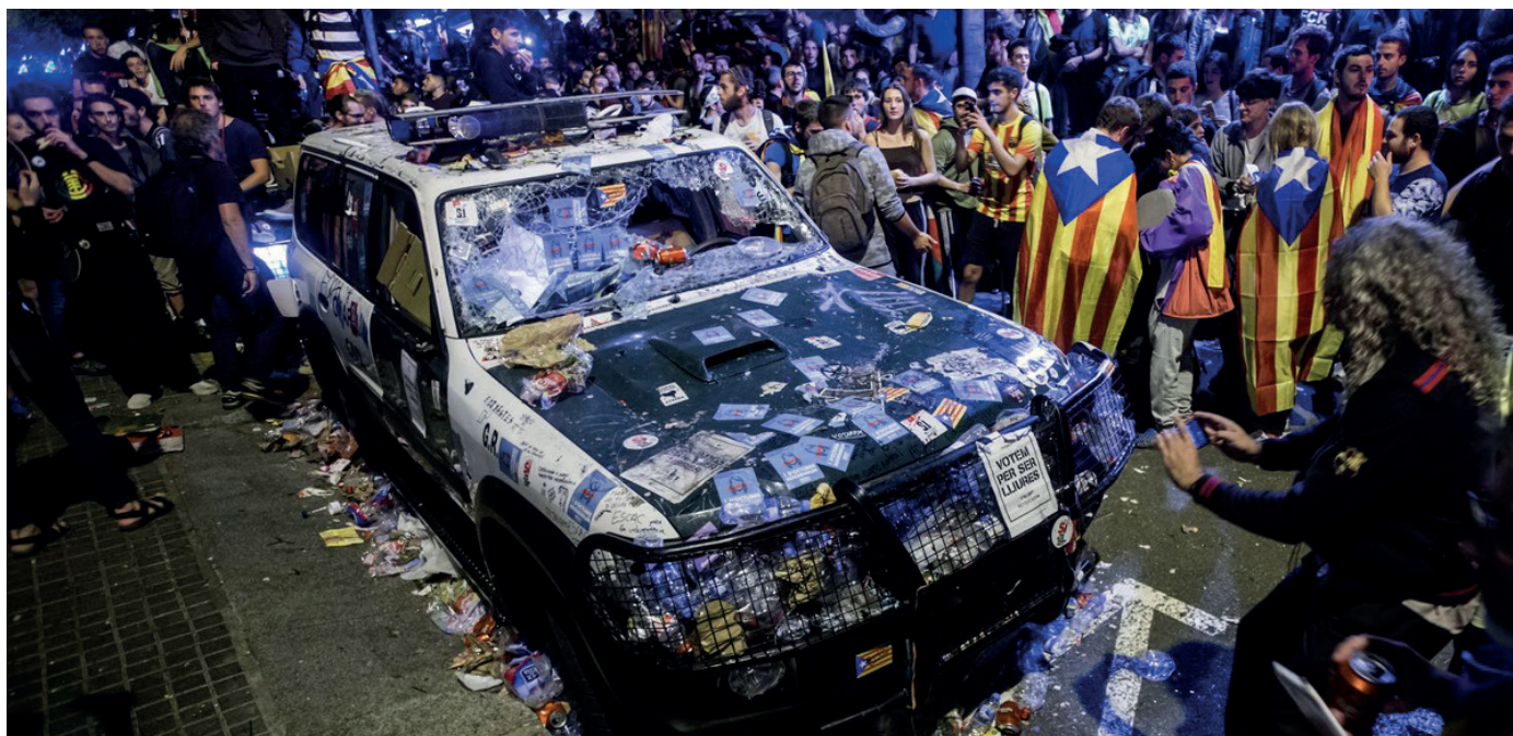
Uno de los vehículos oficiales de la Guardia Civil que fueron atacados el pasado septiembre en Barcelona.