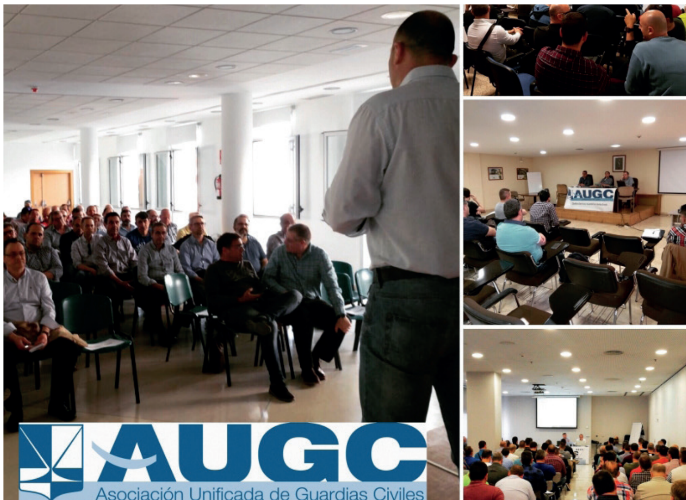
Imágenes de varias asambleas provinciales que se han celebrado recientemente.

Los meses de abril y mayo dieron fecha a la celebración de numerosas asambleas en las delegaciones provinciales de AUGC, registrándose en todas ellas una alta asistencia y participación que demuestran la excelente vitalidad de que goza nuestra organización.