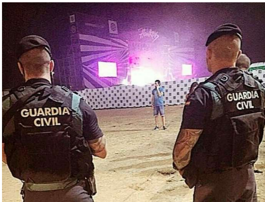
Dos guardias civiles con tatuajes visibles.

que los guardias civiles estén desmotivados y pierdan, por tanto, eficacia, lo que se verá sin duda reflejado en el servicio que recibe el ciudadano. AUGC Madrid se pregunta si no sería mucho más fácil poner de su parte para mejorar el bienestar de los agentes a través de medidas incentivadoras en vez de ponerles palos en las ruedas.