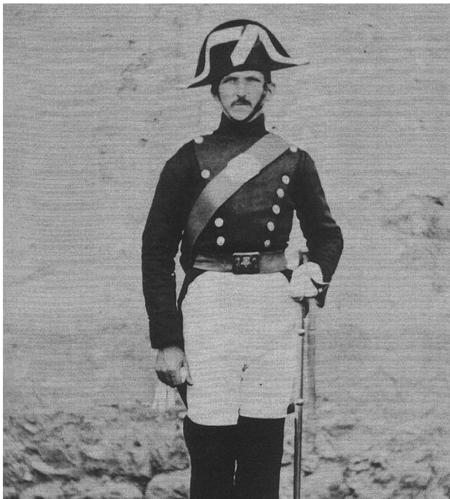
Primera fotografía conocida tomada a un guardia civil, en Reinosa entre 1855 y 1857. William Atkinson.

teñido el pelo o un pendiente no debe significar que vas a ser mejor o peor guardia civil o que vayas a prestar mejor o peor servicio al ciudadano, incluso puede ser todo lo contrario. El todo por la imagen del cuerpo no puede solapar el derecho de la imagen personal.