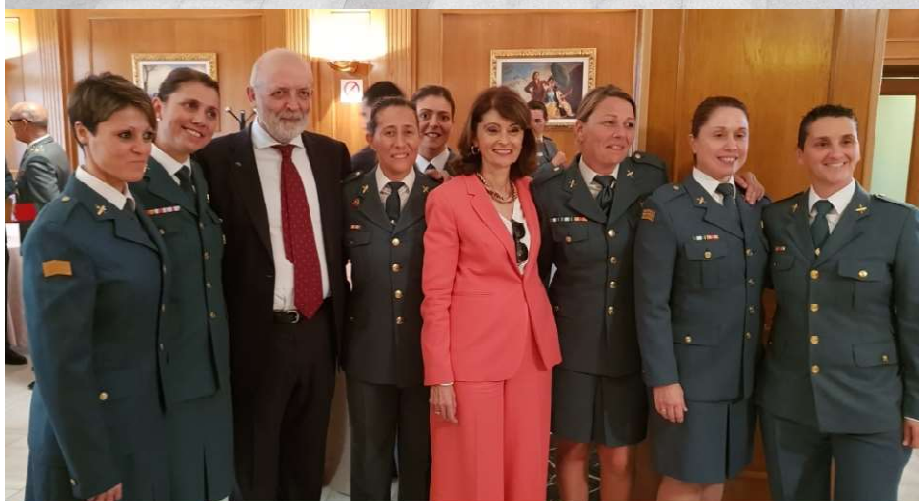
Arriba, en el encuentro con la reina Letizia Ortiz. A la izquierda, el encuentro del Comité de Igualdad con las autoridades.

Por su parte, Carmen Calvo explicó que desde el Gobierno “apuestan por la igualdad dentro del Cuerpo” y que tenía “total disposición para el diálogo con las asociaciones”.