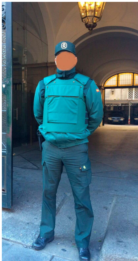
La uniformidad bicolor es más cómoda y segura

De esta forma, los guardias en reserva con destino en edificios de la Administración de la Comunidad de Madrid no