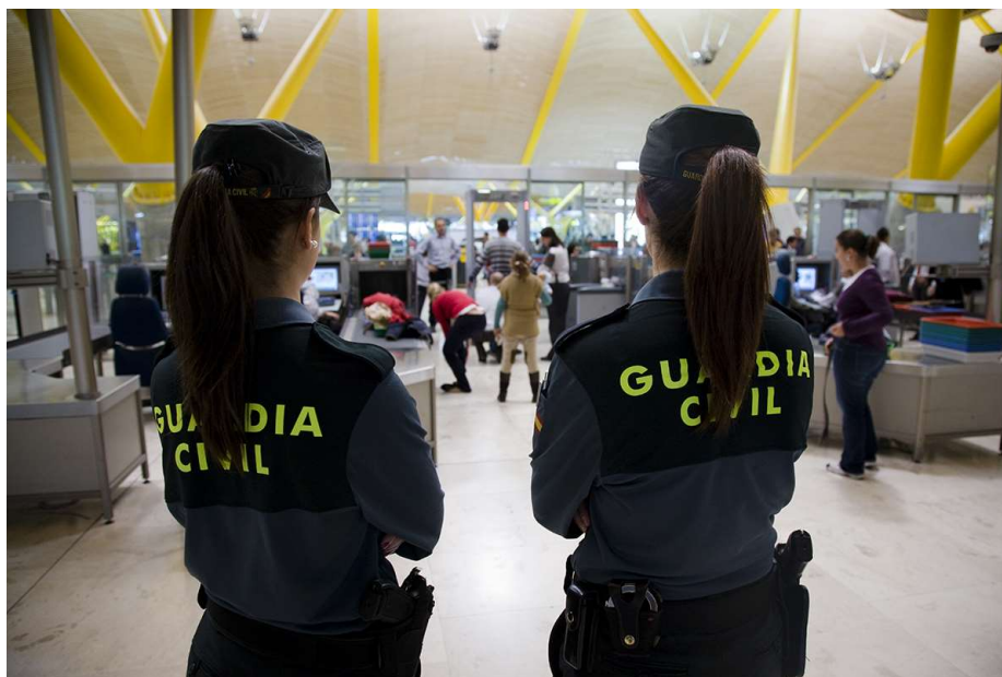
Los trabajos de la consultoría externa ya han comenzado. Mismo trabajo, mismo salario.

La consultora comenzó su exposición dejando claro su absoluta independencia y el rigor con el que pretenden hacer su función. Igualmente, recordó que su cometido es realizar una comparación de funciones entre