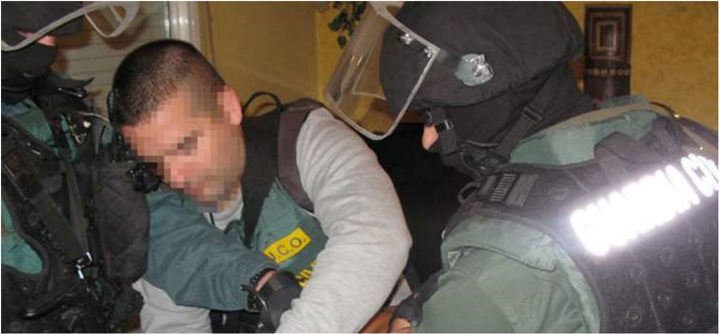
Varios agentes en acto de servicio.