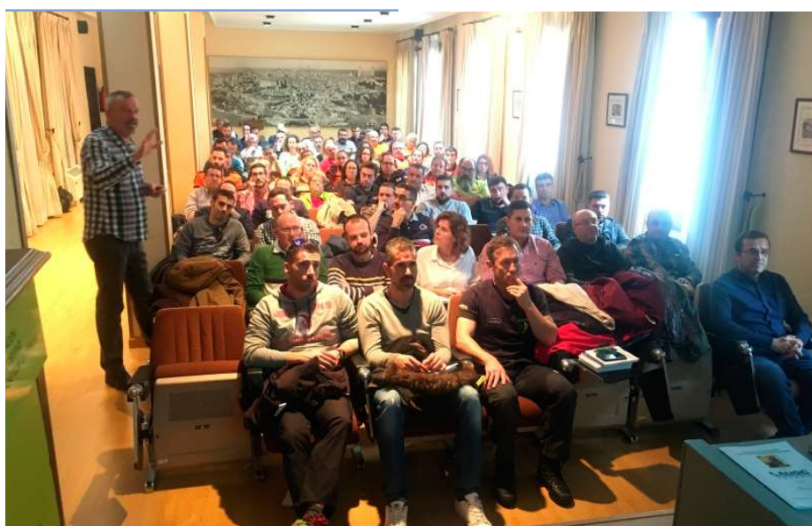
En las dos fotos de arriba, algunos de los ponentes. Abajo, el público asistente a las jornadas.