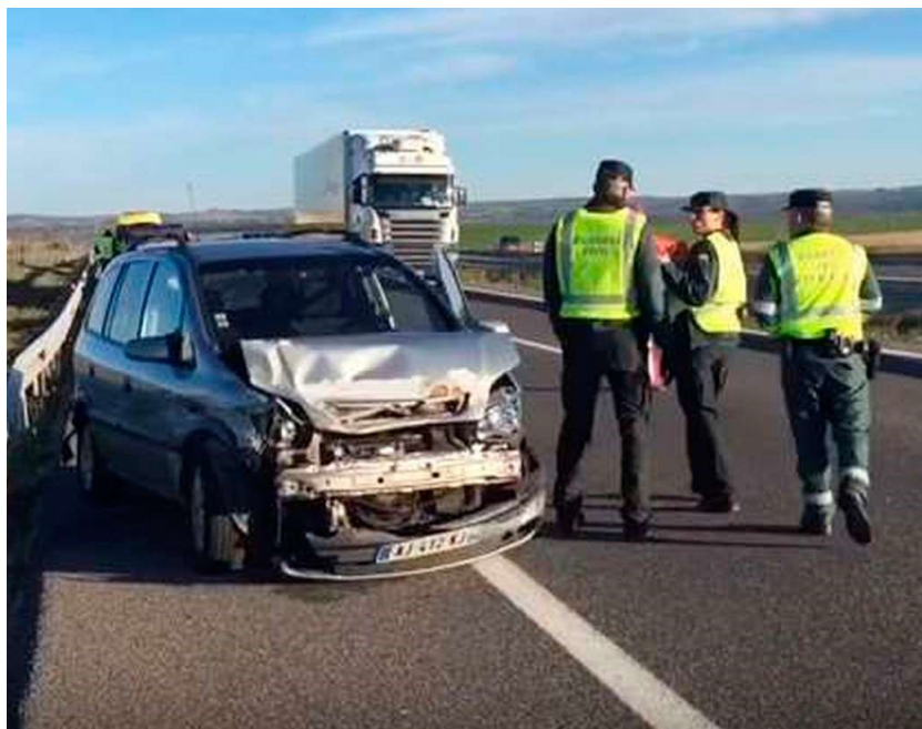
Agentes de la Agrupación de Tráfico, en una foto de archivo.

tección durante el servicio, haciendo hincapié en los dispositivos de alcoholemia. Hay que dictar instrucciones claras a los mandos responsables de estos dispositivos para que la voracidad por realizar pruebas o alcanzar determinados objetivos no haga que se introduzcan en ellos un número de vehículos superior al de