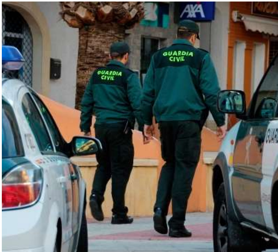
Dos guardias civiles, en una fotografía de archivo.

Desde AUGC reclamamos una mayor firmeza de todos los poderes públicos frente a estos ata-