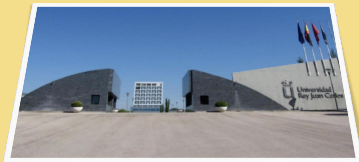
Campus de Móstoles de la URJC

La colaboración de la Escuela Europea de Ciencias, con la Universidad Rey Juan Carlos se produce tras convenio suscrito en el año 2013, y siendo renovado en el año 2017 con la inclusión de titulaciones de Experto Universitario, Especialista Universitario y Máster, dentro de los programas formativos. Aúna la experiencia y amplia trayectoria del Patronato del Centro Universitario con el reconocido prestigio de la URJC, una de las seis universidades públicas de la Comunidad de Madrid. Su nombre es homenaje al Rey Juan Carlos I y fue creada