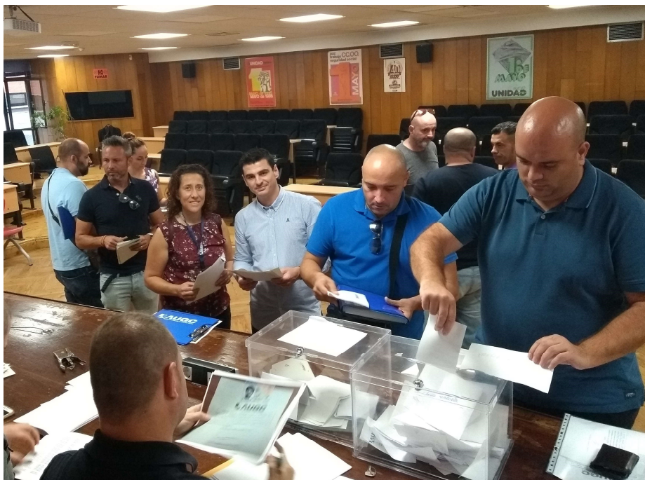
La nueva Junta Provincial de AUGC Madrid fue elegida en septiembre