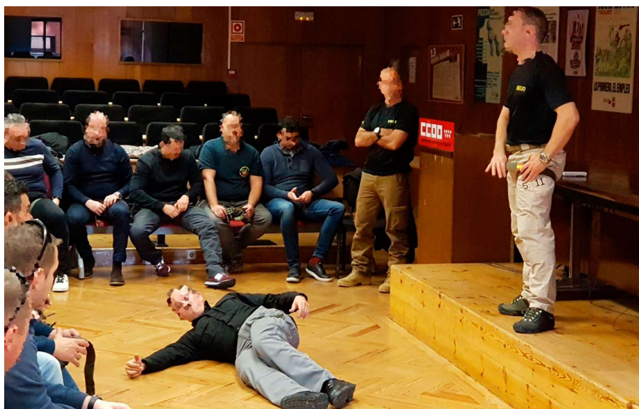
Uno de los cursos de formación dirigido a vocales y afiliados de AUGC Madrid

AUGC Madrid también ha denunciado, a lo largo del año, diferentes situaciones y problemas de los guardias civiles, como las condiciones precarias de la unidad del GRS de Madrid destinada en Cataluña, el cambio de funciones de los guardias de conducciones, el traslado de la unidad de Reconocimiento de Subsuelo, el incumplimiento