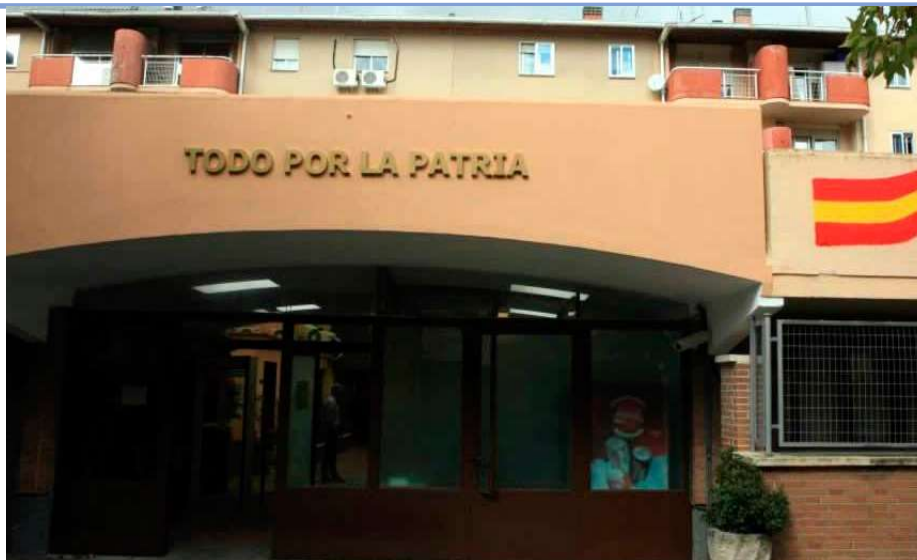
El cuartel de Tres Cantos

Después de estos temas hablamos sobre acuartelamiento e instalacio-