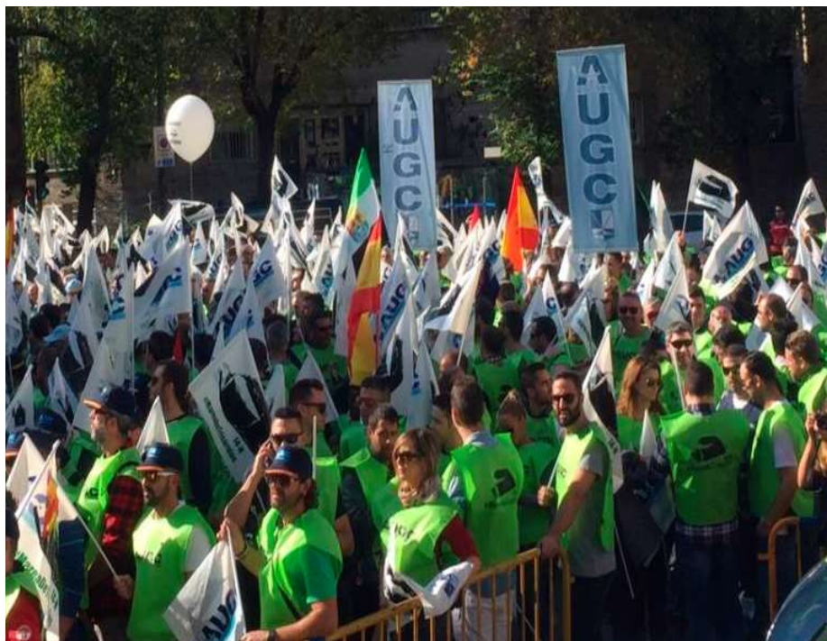
Una de las movilizaciones llevadas a cabo por AUGC.

Al comenzar el año no parecía tan claro que pudiera conseguirse, pero el 12 de marzo las asociaciones profesionales representativas de la Guardia Civil y los sindicatos de la Policía Nacional firmaron con el Ministerio del Interior el acuerdo, que contemplaba una cantidad de 1.407 millones distribuidos a lo largo de tres años (2018-2020). Después de que en octubre las primeras cantidades