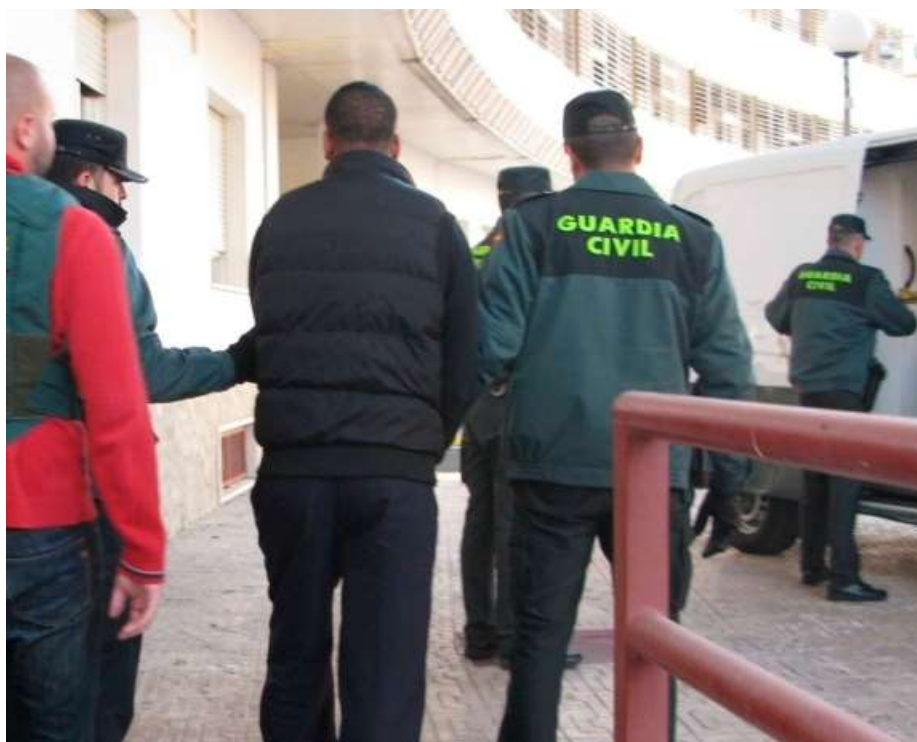
Un preso es trasladado por varios guardias civiles

Otra cuestión preocupante son los traslados de presos o detenidos en ambulancias, con