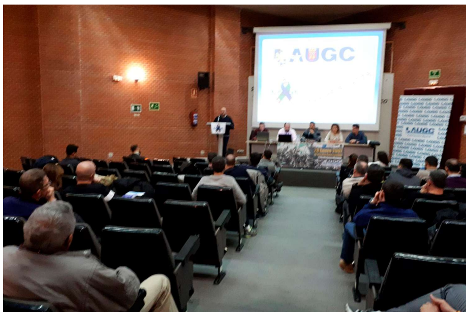
Asamblea de AUGC Madrid