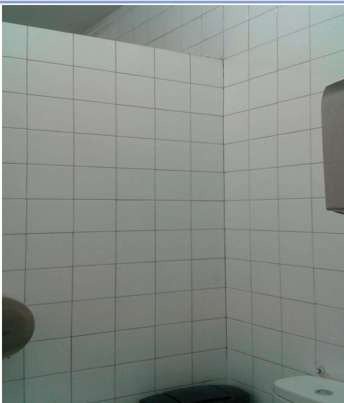
A la izquierda, los “vestuarios” femeninos de los juzgados de Plaza de Castilla. A la derecha, los cuartos de baño.