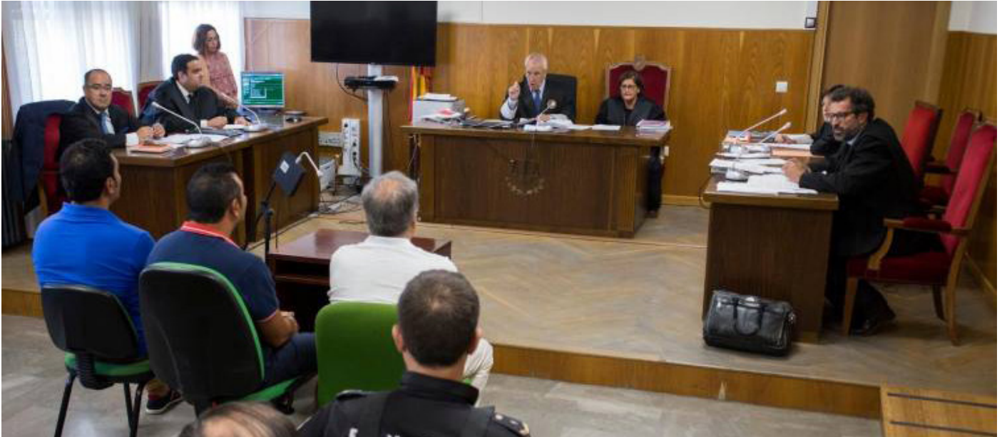
Imagen del juicio por la agresión en Punta Umbría a un policía local.

La Asociación Unificada de Guardias Civiles en Huelva expresa su apoyo a la Policía Local de Punta Umbría, y en especial al Subinspector Jefe agredido el pasado día 7 de agosto en dicha localidad onubense. Asimismo, tras el juicio celebrado el pasado 22 de agosto, no podemos sino expresar nuestra sorpresa y malestar por la petición de tan solo dos años de condena aceptada por la Fiscalía y acordada con la defensa, para así facilitar que el agresor pueda eludir la prisión. Nos solidarizamos igualmente con todos los miembros de las F.C.S.E., que ante el acuerdo suscrito entre Fiscalía y defensa quedan indefensos ante agresiones de esta naturaleza y vemos cómo, sin una acusación particular que nos defienda en estos casos, los organismos del Estado no protegen de forma adecuada a los agentes que son agredidos, con peticiones de penas a todas luces insuficientes.