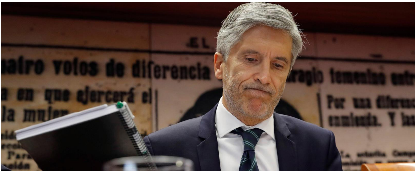
El ministro del Interior en funciones, Fernando Grande-Marlaska.

En segundo lugar, AUGC plantea la sustitución de los más de 900 vigilantes privados que hay en los centros penitenciarios por guardias civiles en situación de re-