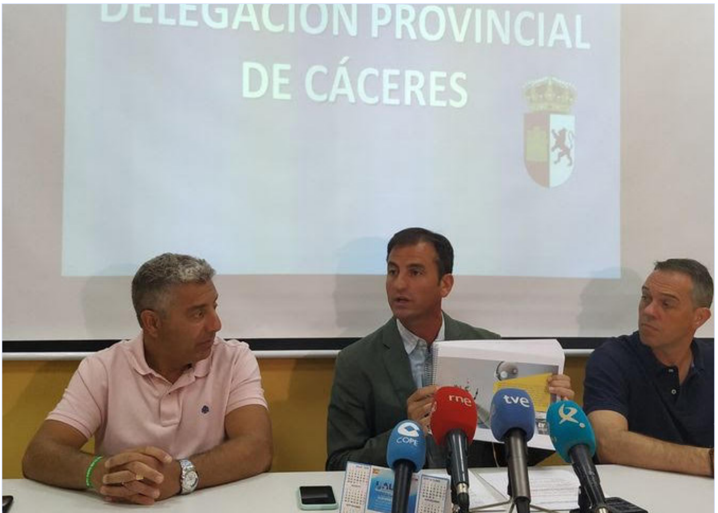
Imagen la rueda de prensa que se ofreció en Cáceres el pasado 23 de agosto