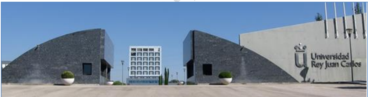
Campus de Móstoles de la URJC

La colaboración de la Escuela Europea de Ciencias, con la Universidad Rey Juan Carlos se produce tras convenio suscrito en el año 2013, y siendo renovado en el año 2017 con la inclusión de titulaciones de Experto Universitario, Especialista Universitario y Máster, dentro de los programas formativos. Aúna la experiencia y amplia trayectoria del Patronato del Centro Universitario con el reconocido prestigio de la URJC, una de las seis universidades públicas de la Comunidad de Madrid. Su nombre es homenaje al Rey Juan Carlos I y fue creada por la ley 7/1996, de 8 de julio de 1996, con el lema latino Non nova, sed nove (“No cosas nuevas, sino de una manera nueva”), siendo su eslogan “Pública y preparada para ti”. Según los últimos datos estadísticos oficiales del censo de la propia institución, la URJC es la tercera universidad pública de la región en número de estudiantes, con 35.877 estudiantes.