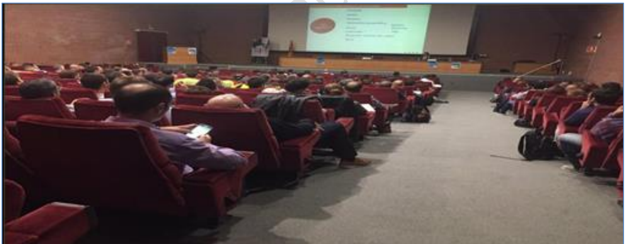
Jornadas Análisis de perfiles criminales de la EEC en el Instituto de Seguridad de Cataluña.

En la EEC, siempre orientada a brindar una atención y trato de excelencia y calidad en la provisión de un servicio diferenciado de formación en seguridad, tanto pública como privada, contamos desde el mismo momento inicial de su nacimiento como proyecto, con el mejor capital humano disponible en el mercado laboral en cada una de sus áreas, con profesionales de elevada cualificación, años de experiencia en todos los ámbitos de la seguridad y de todas y cada uno de aquellas ramas que directa, o indirectamente, interfieren en ella.