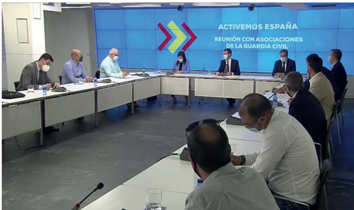
Pablo Casado, durante el encuentro con las asociaciones.

AUGC ha recordado que son muchos los guardias ci-