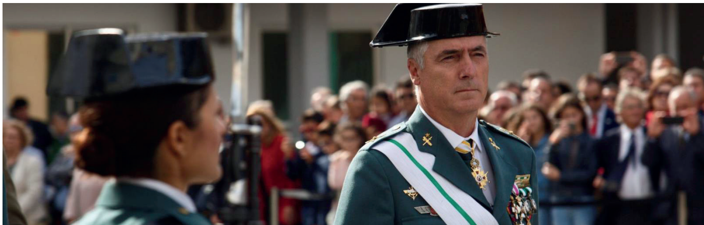
El general de brigada Félix Blázquez, durante un acto oficial.