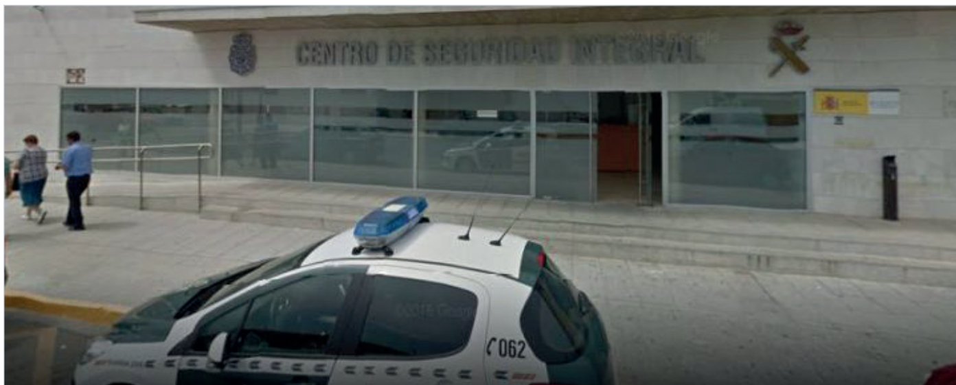
Puesto principal de Tomelloso, en Ciudad Real, a cuyo cargo está el teniente contagiado.

Lejos de mantener las medidas preceptivas de aislamiento, el teniente, pendiente del resultado de una prueba PCR, se presentó en el cuartel repartiendo abrazos sin mascarilla, e incluso besando a las mujeres componentes del puesto. Ahora ha dado positivo.