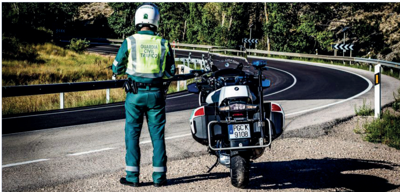
Un agente de Tráfico, junto a su motocicleta.