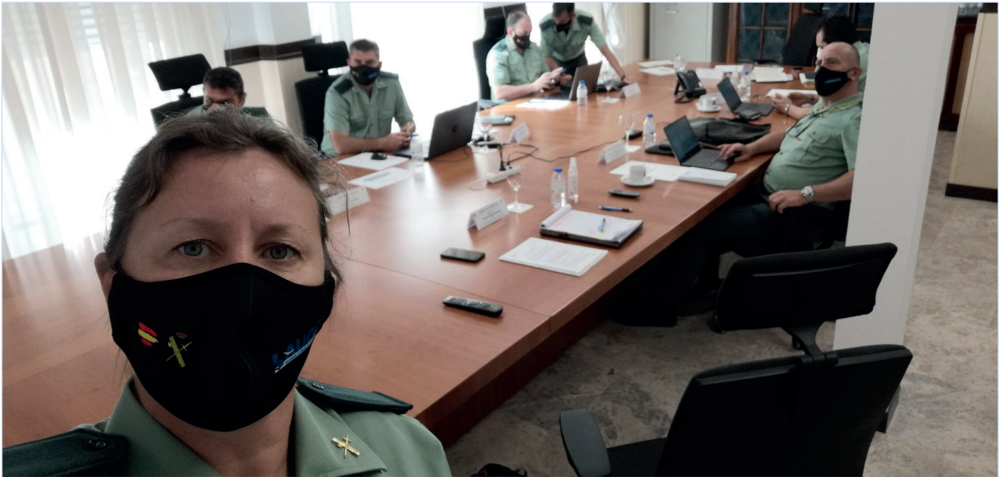
Los vocales de AUGC en el Consejo, instantes antes de la celebración del pleno.