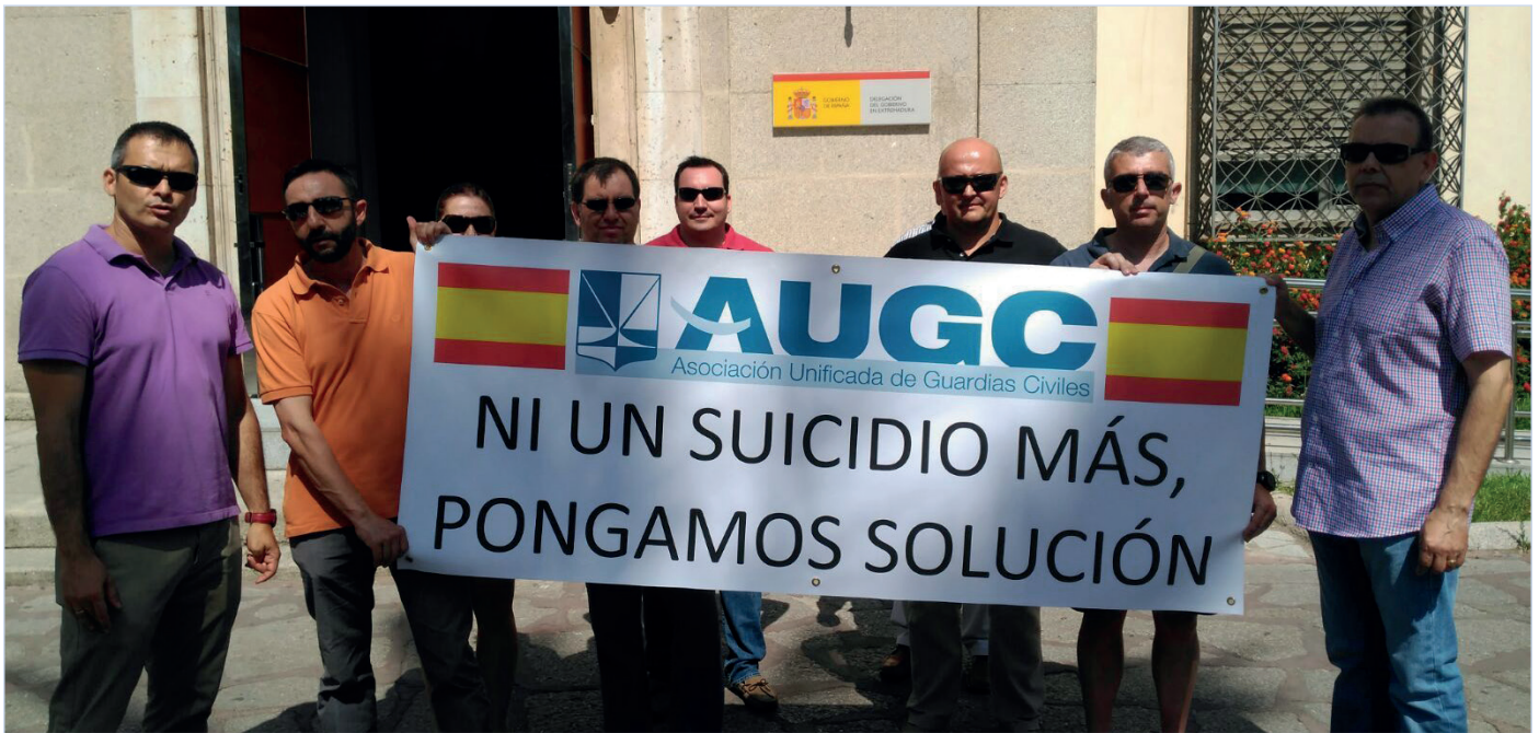
AUGC lleva años reclamando medidas efectivas para reducir la tasa de suicidios en la Guardia Civil. En la imagen, compañeros de la delegación de Badajoz durante una concentración.