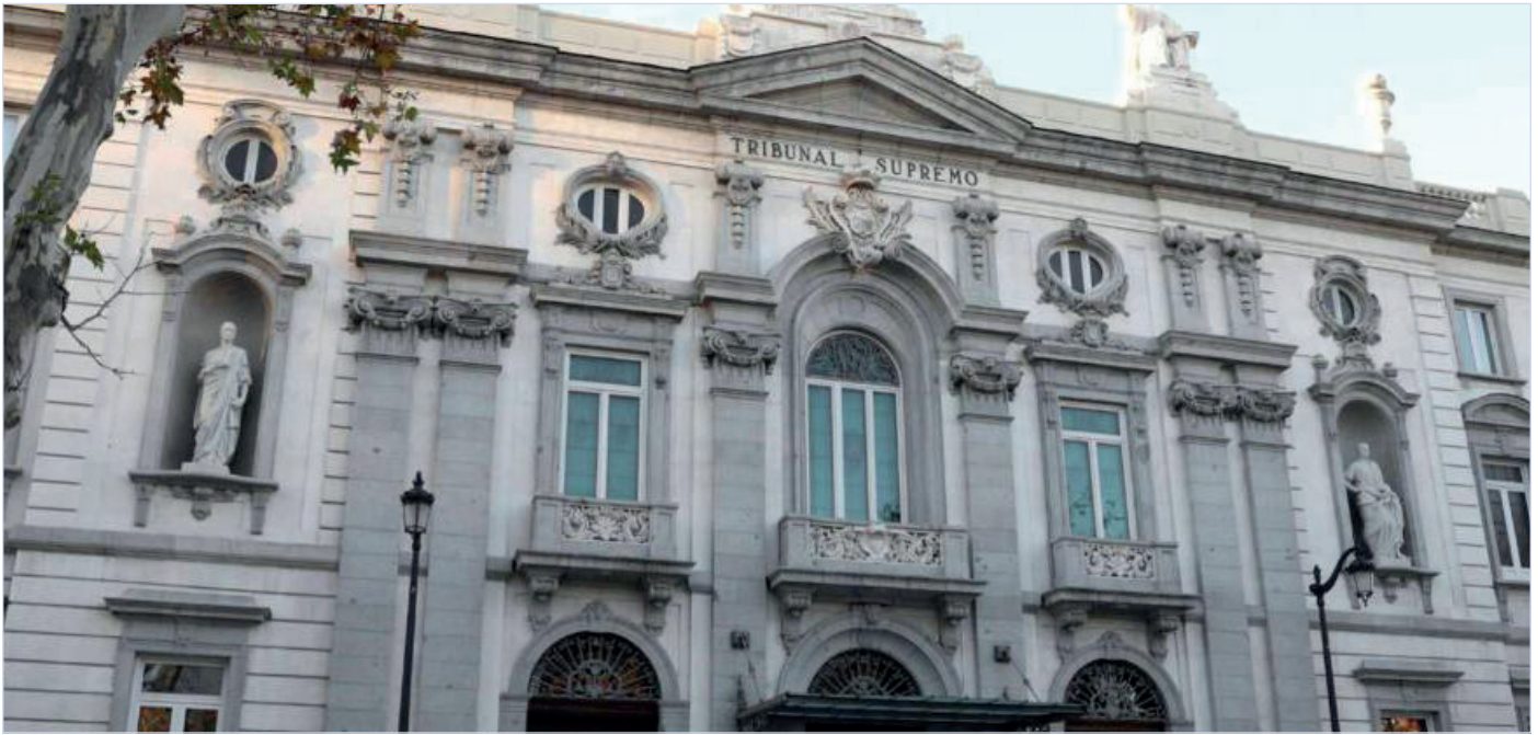
Sede del Tribunal Supremo.