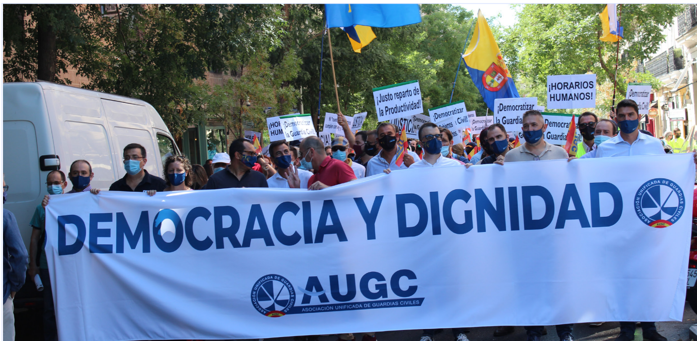
Cabecera de la manifestación, en la que marchaban los miembros de la Junta Directiva Nacional de AUGC.