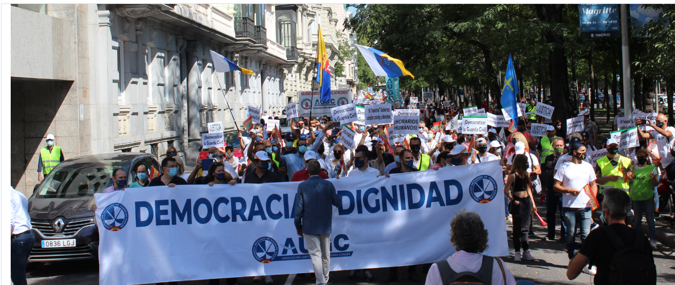
La manifestación, en su momento de llegada ante la sede del Ministerio del Interior.