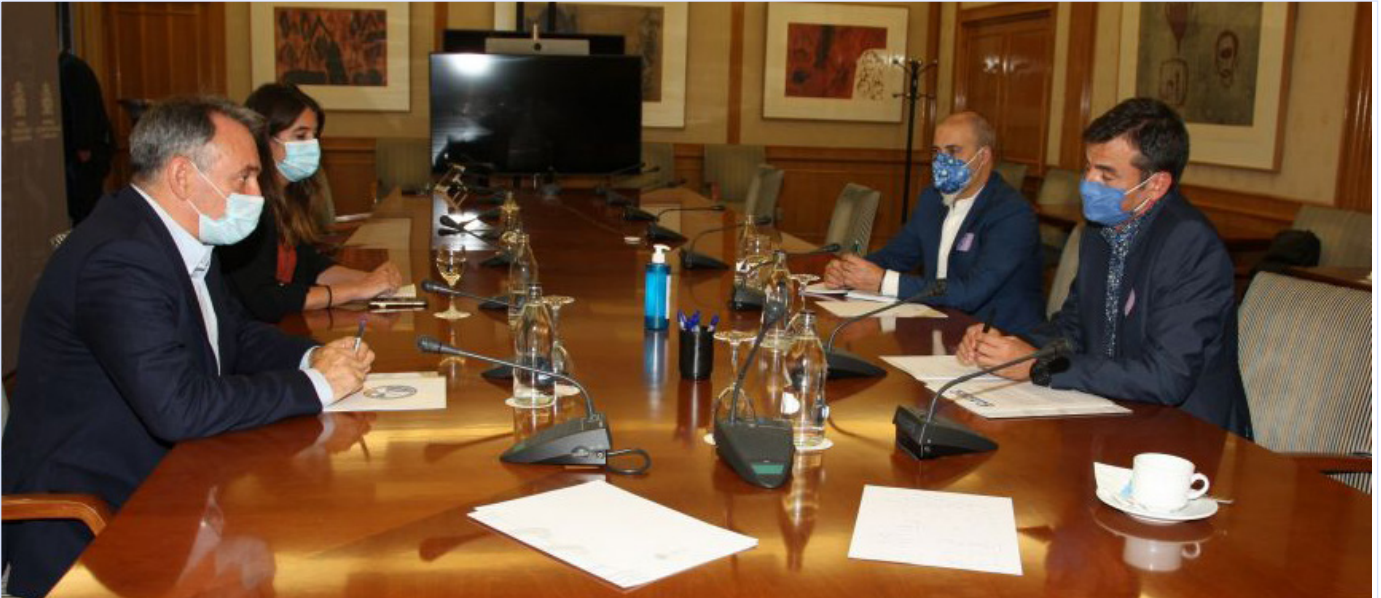
Los representantes de AUGC (derecha), en un momento de la reunión con el secretario de Estado, Enrique Santiago.