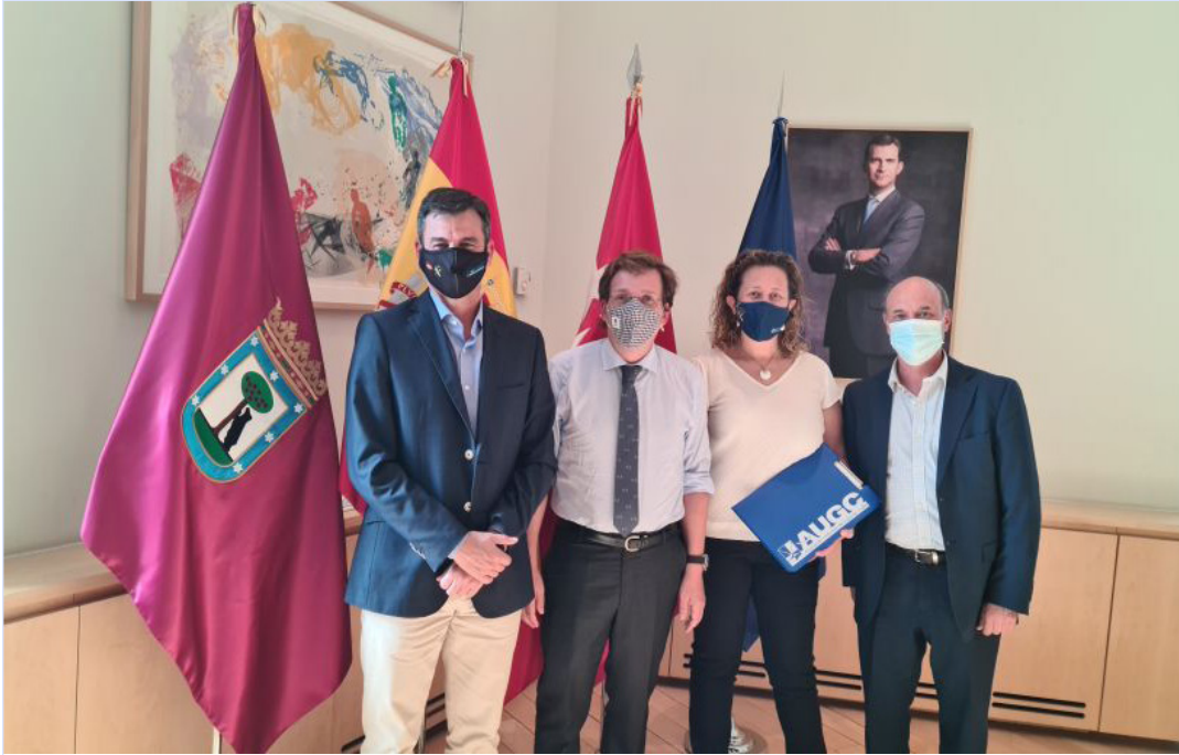
José Luis Martínez-Almeida (segundo por la izquierda) con los representantes de AUGC.