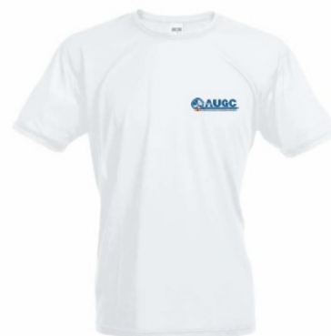
Camiseta técnica AUGC Tallas: S, M, L, XL, XXL