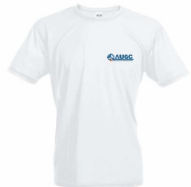
Camiseta técnica AUGC Tallas: S, M, L, XL, XXL