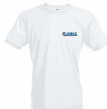
Camiseta técnica AUGC Tallas: S, M, L, XL, XXL