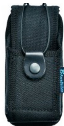
Porta walkie / sirdee universal

Visita la tienda y descubre más... tienda.augc.org