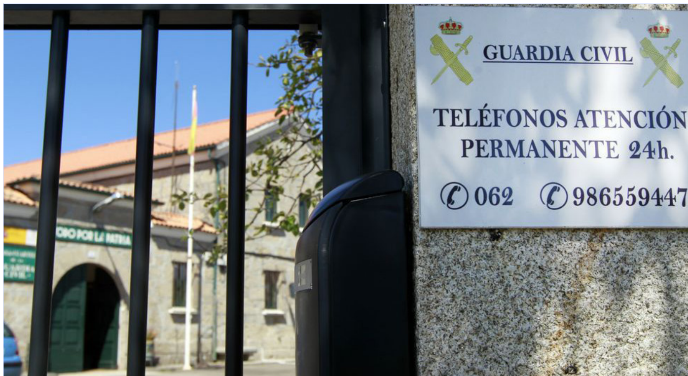
Un cuartel en Galicia con una señal en la que se indican los números para llamadas de emergencia.