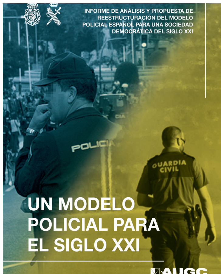
Portada de la nueva publicación de AUGC.